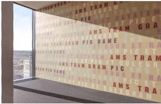
Schriftbild «allover» aus dem sechsteiligen Werk «Piff Paff Puff» in der Anwaltskanzlei Homburger im 29. Stockwerk des Prime Towers, Zürich.