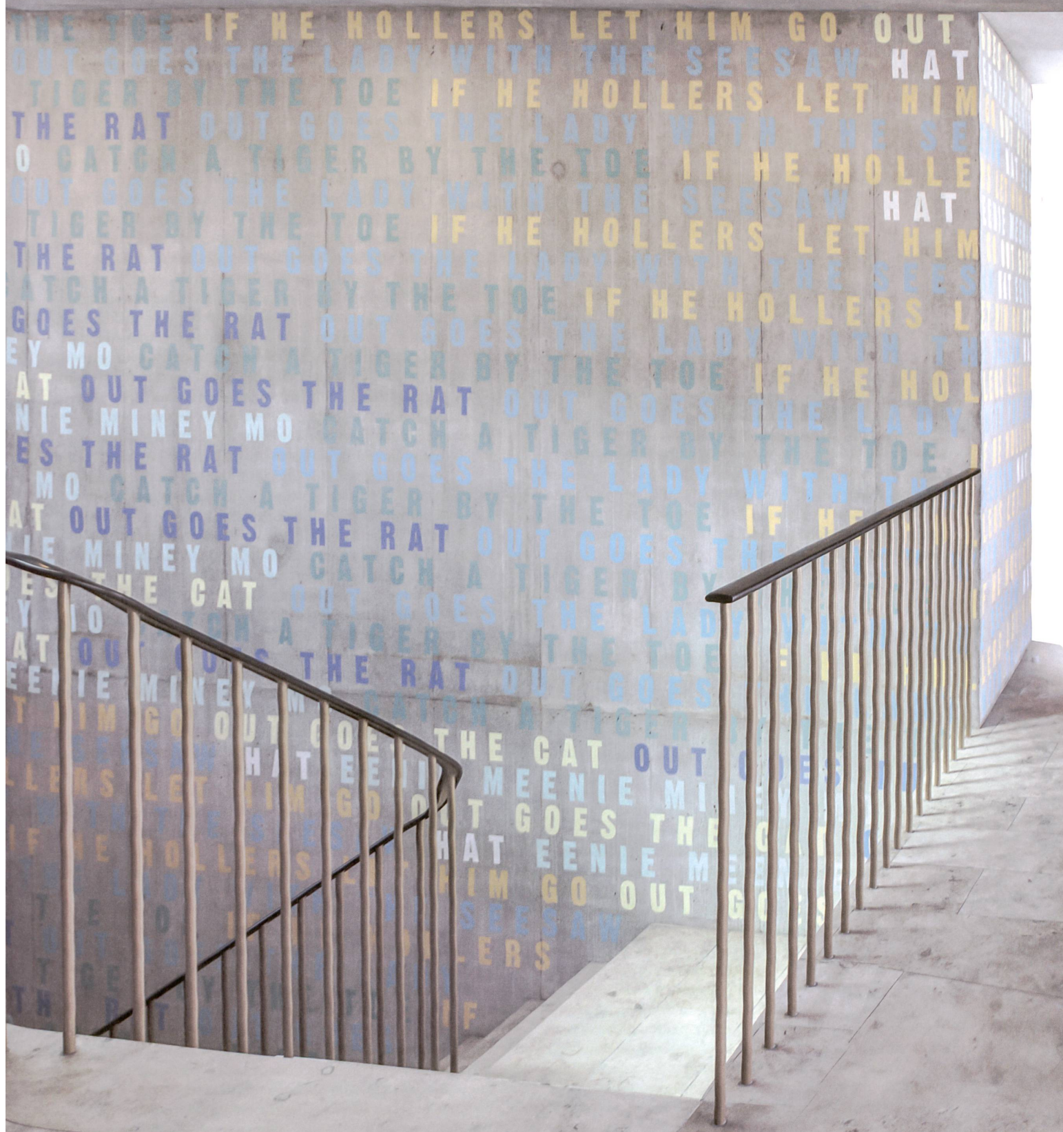
Schriftbild «allover» aus dem siebenteiligen Werk «Akka Bakka» verteilt über das Gebäude der Gesundheitsdirektion des Kantons Zürich.