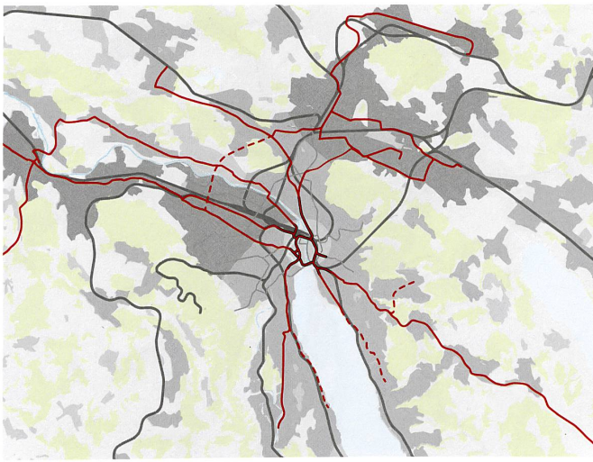
Idee Metrotram, 2011