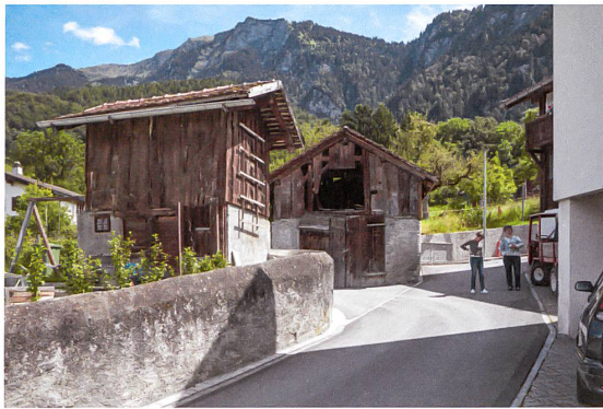
Mauern sind essenziell für den Strassenraum des Schermens.