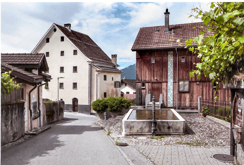
Haus Wettstein aus Stein, eben renoviert, und das Holzhaus Wegelin (1988, Bearth & Deplazes).