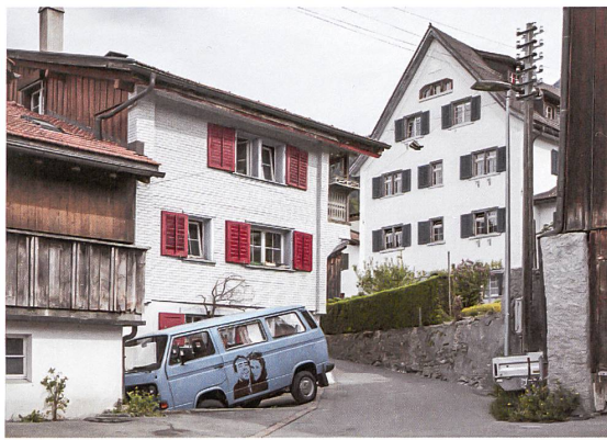
Im Dorf hat jede Person etliche Quadratmeter, denn räumliche Dichte ist nicht gleich soziale Dichte.