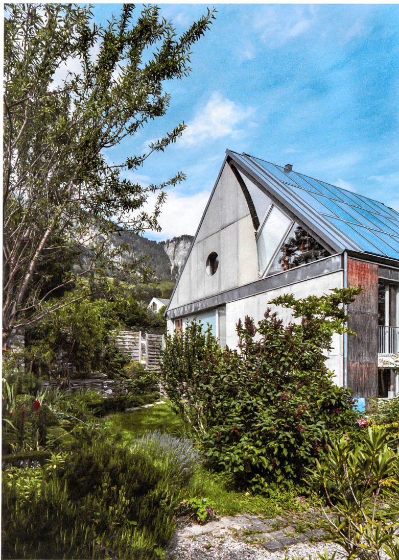
Das experimentelle Haus fürs günstige Wohnen, 1997 von Felix Held gebaut.