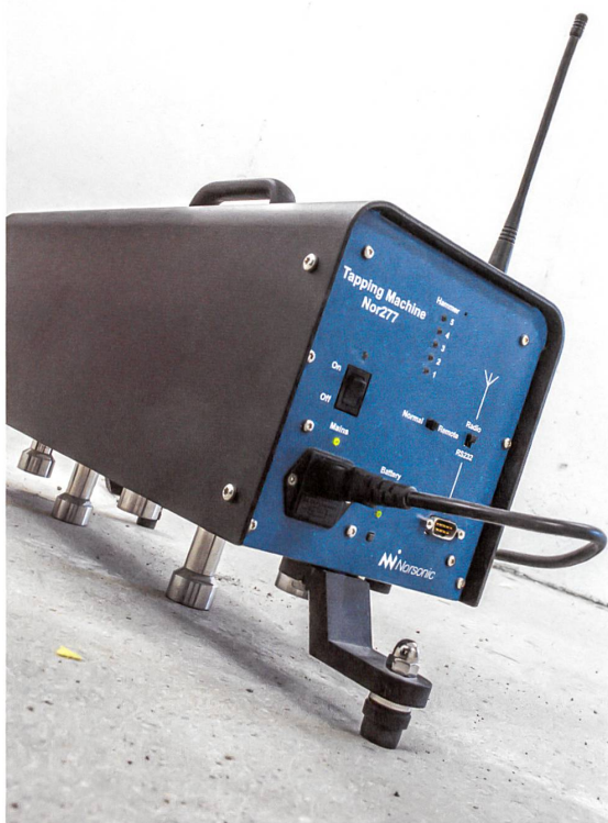
Leise Sohlen oder lautes Stampfen: Das Hammerwerk für die Trittschallprüfung kann beides simulieren.

Im Prüfstand können sowohl vertikale wie auch diagonale Messungen durchgeführt werden. Diese werden immer wichtiger, denn der Schutz vor Körperschall gewinnt mit den stets zahlreicher werdenden Haustechnikinstallationen zunehmend an Bedeutung. «Immer mehr Apparate in einem Gebäude verursachen Vibrationen», sagt Kuster. «Mit Messungen können wir Prognosen zum akustischen Verhalten von Bauteilen machen – dadurch lassen sich diese optimieren, und schliesslich kann die Nutzungsqualität des gesamten Gebäudes gesteigert werden.» Die laute Arbeit im bauphysikalischen Prüflabor bringt so letztlich mehr Ruhe ins tägliche Leben: Das Violinkonzert von Nachbars Hi-Fi-Anlage stört dann ebenso wenig wie die kreischende Kettensäge auf der Baustelle gegenüber oder die Schritte der Bewohnerin im oberen Stockwerk. ●