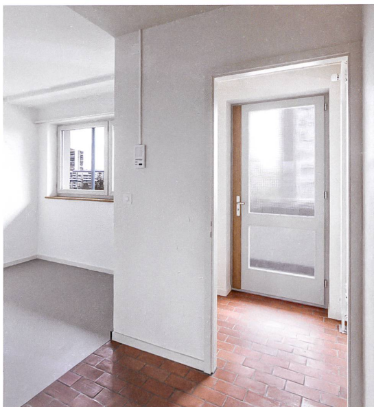
Im Flur liegt noch der alte Klinker, in der Küche neuer Linoleum.