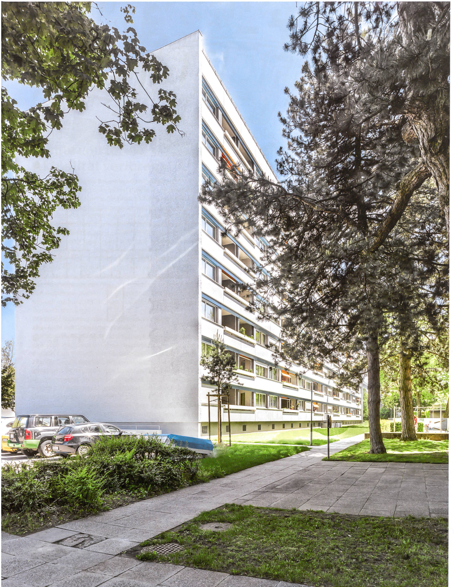
Vergangenheit fortführen: Nur der Putz verrät, wo das Scheibenhochhaus im Tscharnergut in Bern um drei Meter erweitert wurde.