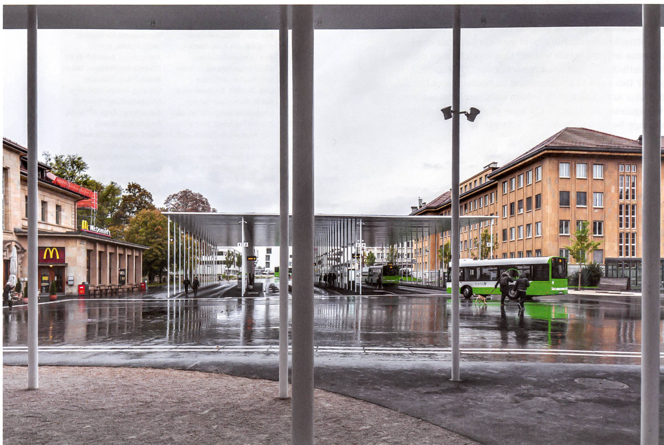
Zwei weisse Dächer ordnen den Bahnhofplatz von La Chaux-de-Fonds neu. Das grössere von beiden schützt die Wartenden im Busbahnhof.

Der Wind pfeift durch die schachbrettartig angelegten Strassen von La Chaux-de-Fonds. Weit ist die Place de la Gare, ihre Häuser sind steingelb und behäbig. Zwei grosse neue Dächer strahlen weiss über dem Platz. Sie drehen sich leicht aus der Richtung, der alle Gebäude folgen. Die Dächer setzen dem Vorhandenen etwas entgegen, dem Wetter und dem Gelb, dem Raster und dem Behäbigen. Trat man früher aus dem Bahnhof, blickte man auf eine →