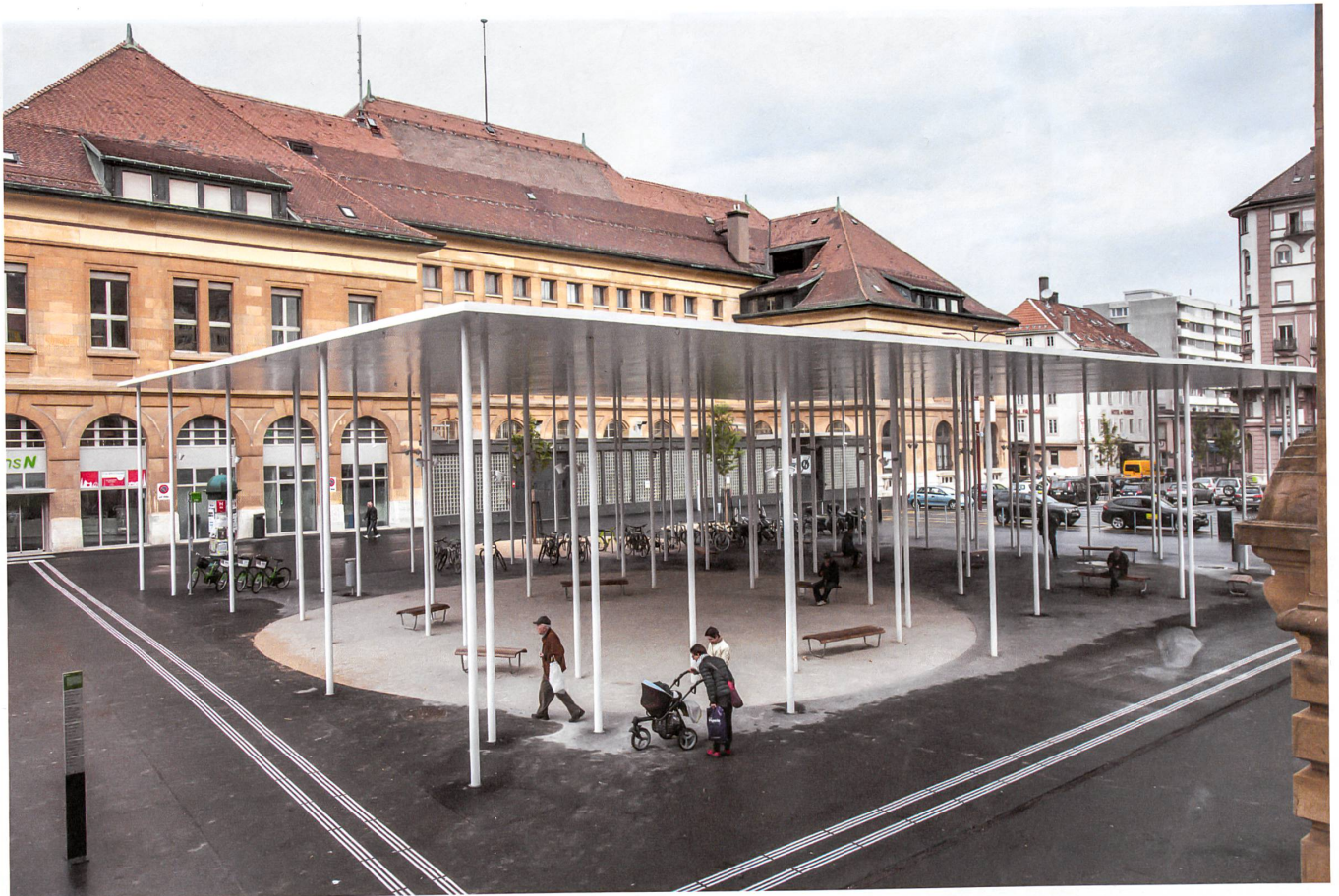
Das kleinere Dach ist den Fussgängern vorbehalten, die darunter auf zwölf Bänken ausruhen können.