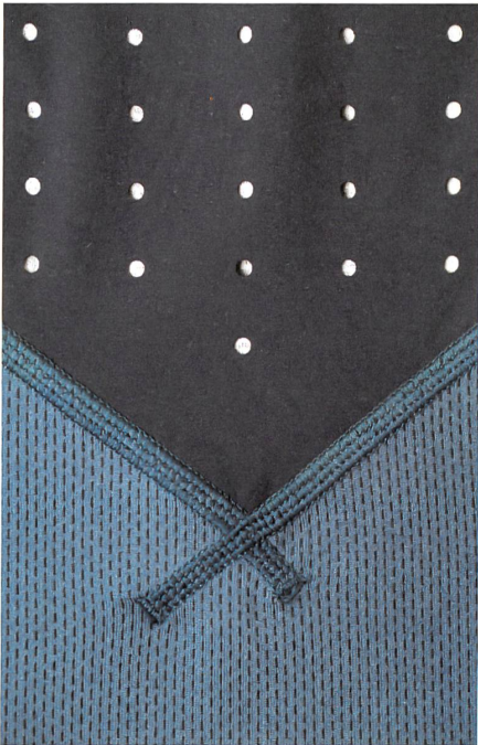
Die Rückenpartie des Langarmshirts für Damen orientiert sich an einem rückenfreien Abendkleid.