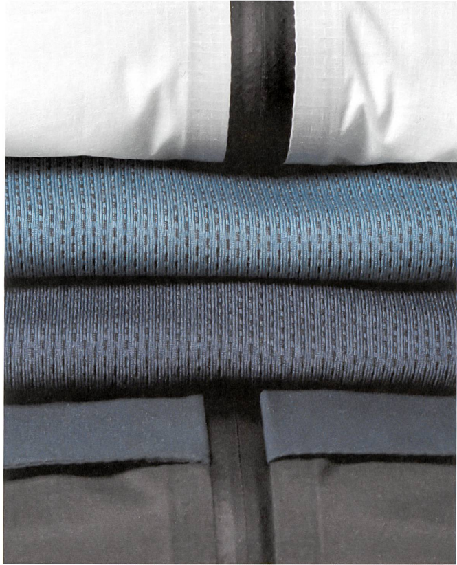
Die Farb- und Materialpalette der «Essentials»-Kollektion.