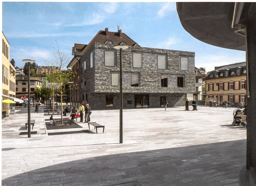
Steinernes Meilen: Der Augengneis am Boden ist gespaltet, jetgestrahlt und geflammt.

Das Projekt besteht aus vier Teilen: der rückseitigen Erweiterung des Gemeindehauses, einem gegenüberliegenden Cafépavillon, einem neuen Parkhaus darunter und dem Freiraum, der in einen Stadt- und einen Schulhausplatz geteilt ist, dem Ganzen eine Adresse verleiht und alles zusammenhält. Anspruchsvoll war die Überwindung des Gefälles gegen den See hin. Die Landschaftsarchitekten lösten das Problem, indem sie die abfallende Fläche in ein jeweils horizontales Oben und Unten mit unterschiedlichen Funktionen teilten: Oben, auf dem Niveau des Gemeindehauses, liegt der Stadtplatz mit Café auf einem harten Gneisplattenfeld, unten, auf dem Niveau des Schulhauses, erstreckt sich neu ein Park mit Spielplatz in einem weichen Kiesfeld. Eine elegante Treppenanlage über die Länge des Cafépavillons verbindet oben und unten und bringt, zusammen mit dem Stein in unterschiedlicher Verarbeitung, die beiden Teile souverän wieder zusammen. Roderick Hönig