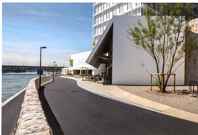
Oben ist der Weg hochwassersicher und nachts beleuchtet. Unten verläuft die Promenade direkt am Wasser.