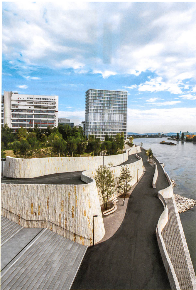
Wellen als Gestaltungsthema einer Rheinuferpromenade in Basel: Die Mauern sind mit Kalksteinbändern verkleidet.