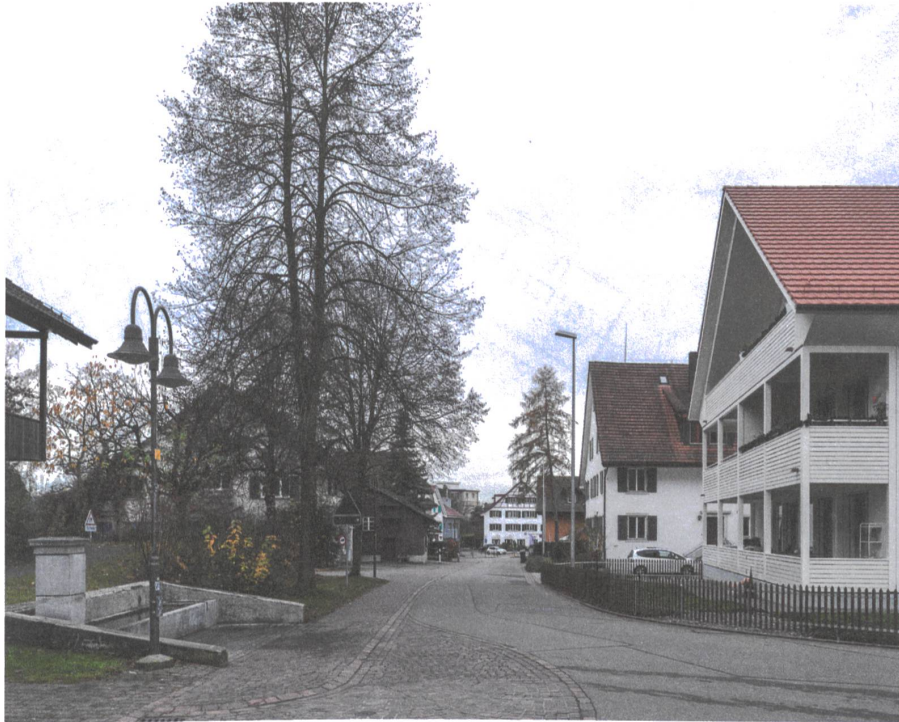
Chamäleonartig passen sich die Häuser ins heterogene Umfeld ein.