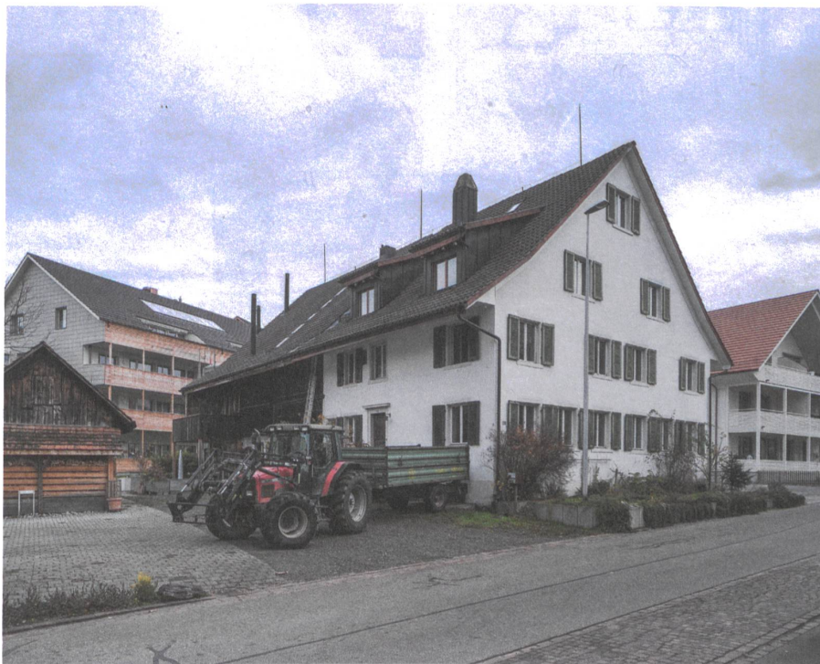
An der Dorfstrasse ist Brüttisellen noch Dorf. Das Bauernhaus ist alt, die Häuser rechts und hinten sind neu.