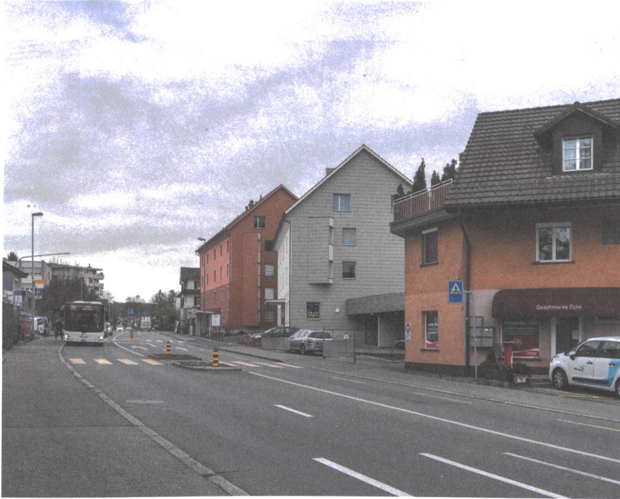
Die Zürichstrasse zerteilt das Zentrum von Brüttisellen. Das rote und das helle Haus gehören zur Überbauung.