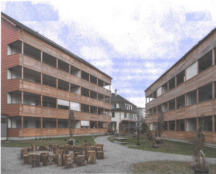
Im Hof haben die Häuser den Charakter einer Siedlung. Stauden werden gepflanzt, Bäume folgen im Frühjahr.