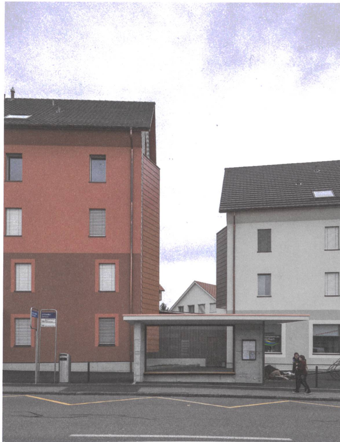
Der Architekt machte viele Zugeständnisse und seine Häuser weniger abstrakt. Sein Realismus wurde von der Brütiseller Realität überholt.

→ Bushaltestelle das Trottoir zu einem kleinen Platz. «Im Frühjahr kommt noch eine Dorflinde mit Landibank dazu.» Der Satz kommt ohne jede Ironie. Später wird Keller sagen, man müsse das soziale Umfeld, in dem man als Architekt jeweils arbeite, ernst nehmen.