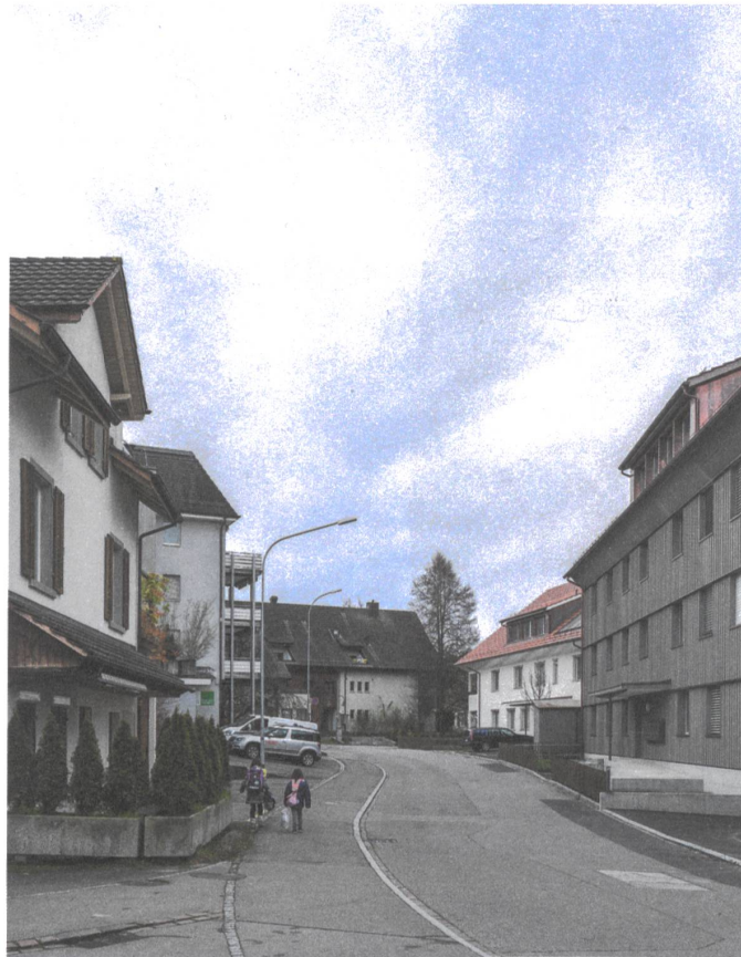
Die beiden neuen Häuser rechts haben zwar Schleppgauben und Dachüberstände, dafür aber solide, zweischalige Fassaden.

→ über die einfachen Volumen, auf jeder Seite eine andere - an die Putzhaut stösst die Eternithaut und diese an die Holzhaut, das Dach sollte auf der einen Seite aus einer Fotovoltaikhaut bestehen und auf der anderen aus einer Ziegelhaut. Der Architekt versuchte, aus den Bildern des Ortes Baukunst zu machen. Und scheiterte.