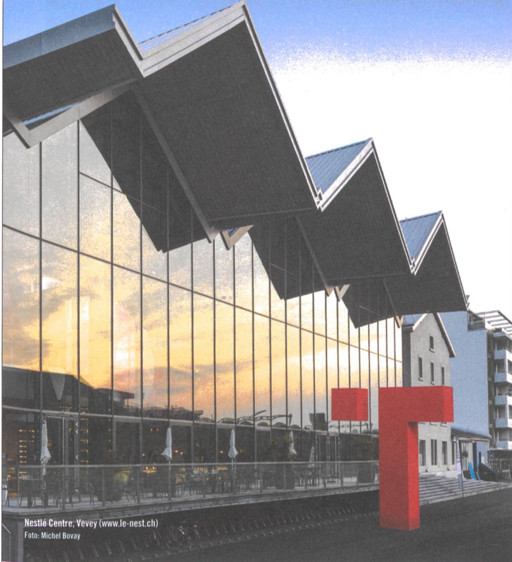
Nestlé Centre, Vevey (www.le-nest.ch)