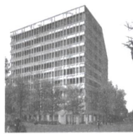
Inselspital BB6.1 Bern