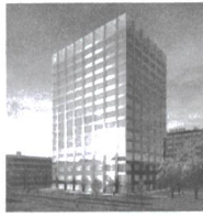
Biozentrum Universität Basel