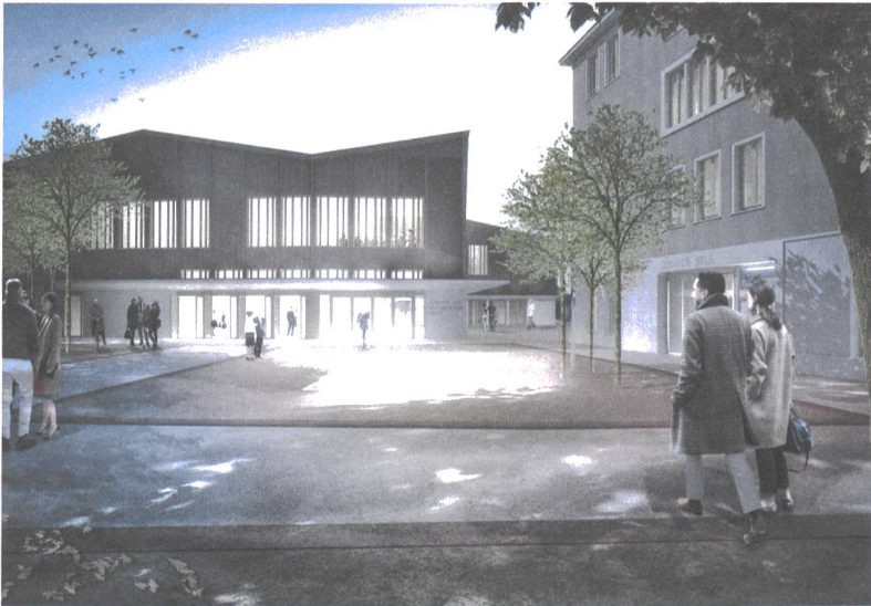
Das Gemeinde- und Kulturzentrum soll den Kern von Mels stärken – architektonisch und gesellschaftlich. Illustration: Raumfindung Architekten