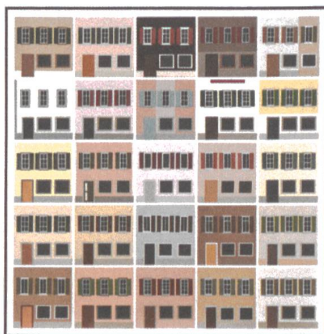
Eine Farbanalyse zeigt die Eigenheiten der Melser Bebauung und dient als Leitfaden für Bauprojekte.