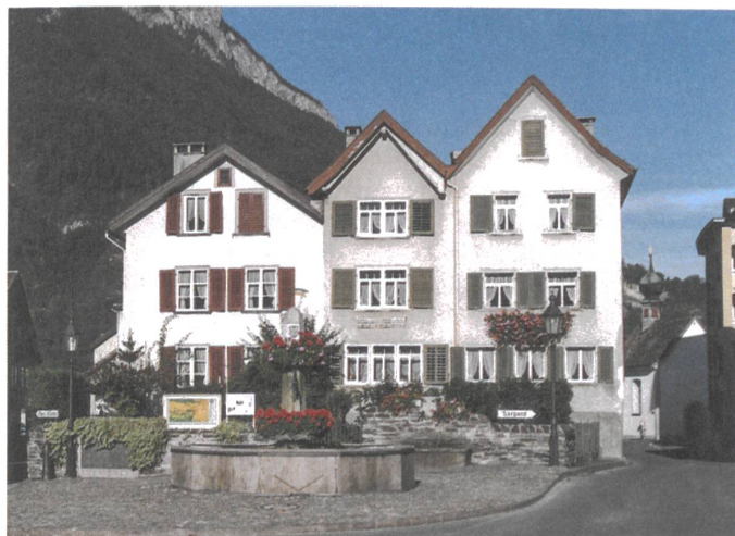
Das Dreigiebelhaus wird saniert und mit einem Café belebt.