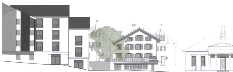
Historische Bausubstanz bildet zusammen mit Neubauten einen Platz. Entwurf (Bachelorarbeit): Julia Weder