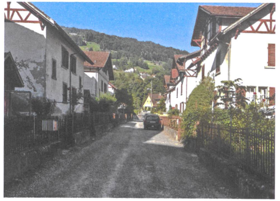
Heute dämmert die Siedlung vor sich hin und wartet darauf, aus dem Dornröschenschlaf geweckt zu werden.