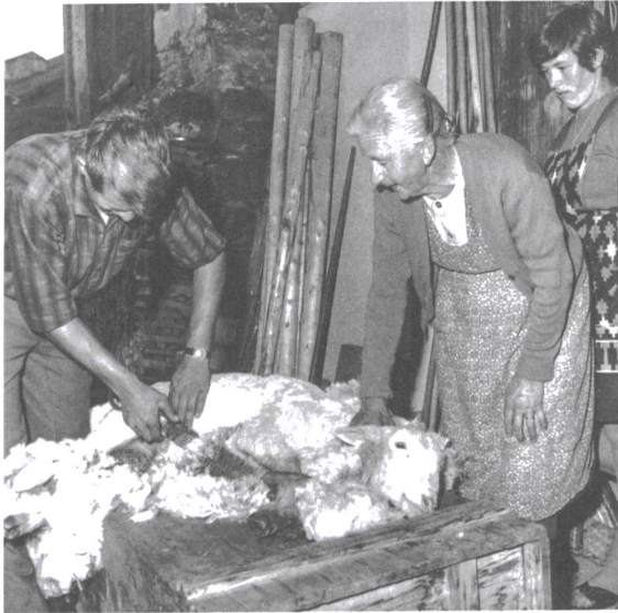
Schafschor in Vals (1980er-Jahre).