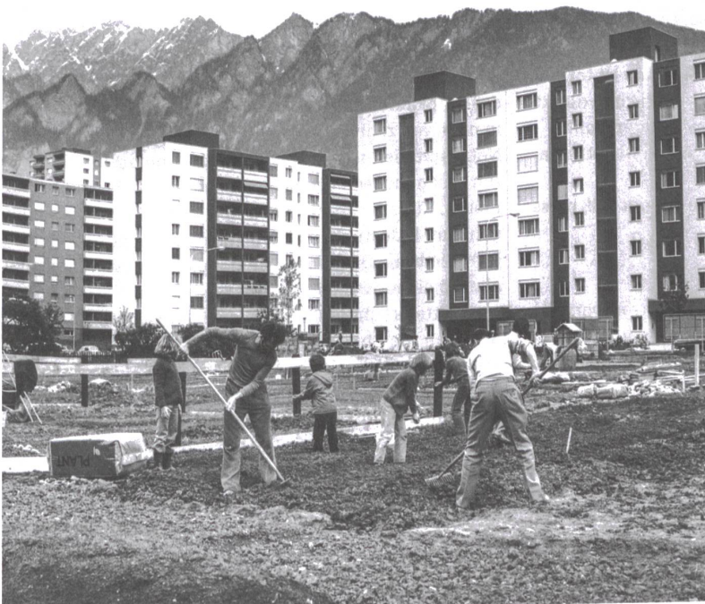
Arbeit in den Schrebergärten im Frühling in Chur (1980er-Jahre).