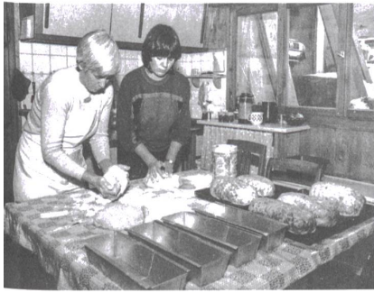
Bei der Zubereitung von Birnbrot im Prättigau (1980er-Jahre).