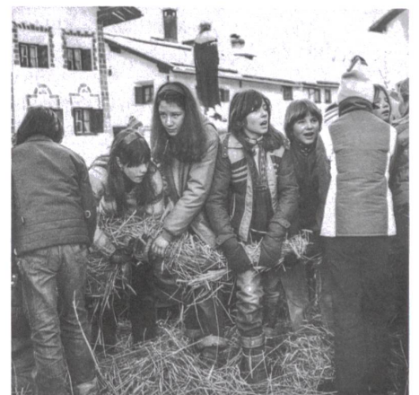
«Hom strom» in Scuol. Das Stroh wird unter Gesang der Jugend gedreht und geflochten, um eine feste Strohuppe herstellen zu können (1980er-Jahre).