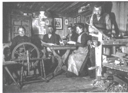
Gemeinsamer Winterabend in einer Valsener Stube (1920er-Jahre).