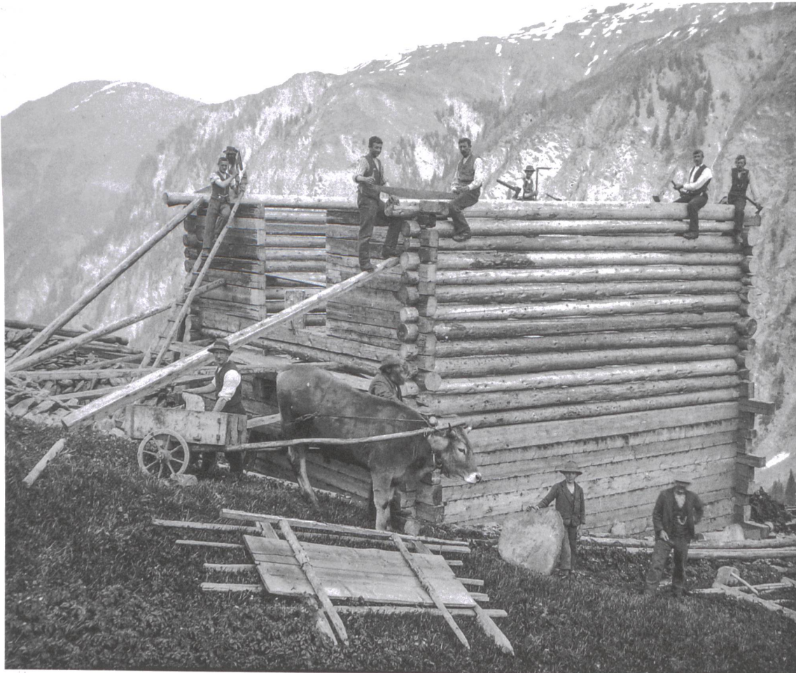
Bau eines Stalls in Safien Camana (1930er-Jahre).