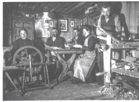
Gemeinsamer Winterabend in einer Valsener Stube (1920er-Jahre).