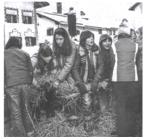
«Hom strom» in Scuol. Das Stroh wird unter Gesang der Jugend gedreht und geflochten, um eine feste Strohuppe herstellen zu können (1980er-Jahre).