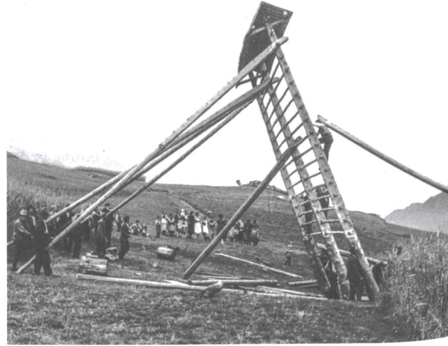
Aufrichten einer Kornhiste in Mompé-Tujetsch (1938).