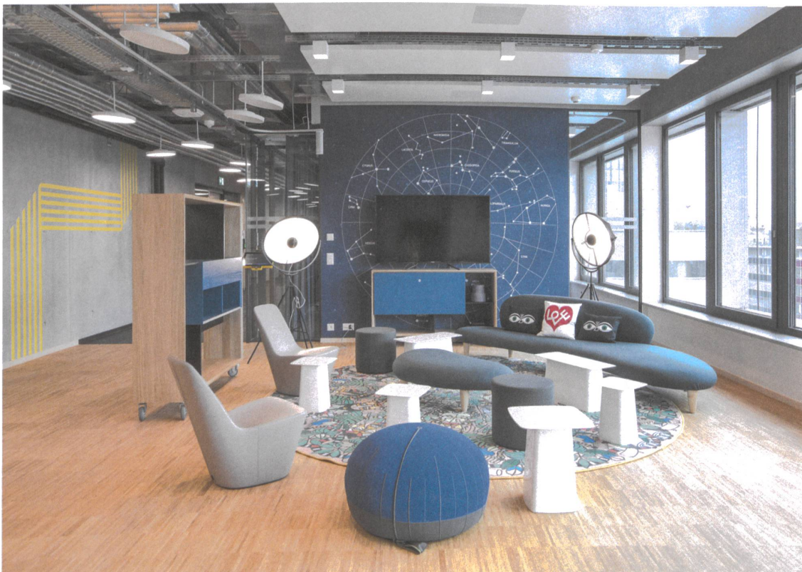
«Welle 7» in Bern: Die Lounge ist auch Besprechungsecke, Präsentations- oder Seminarraum. Innenarchitektur: Daskonzept, Thun.