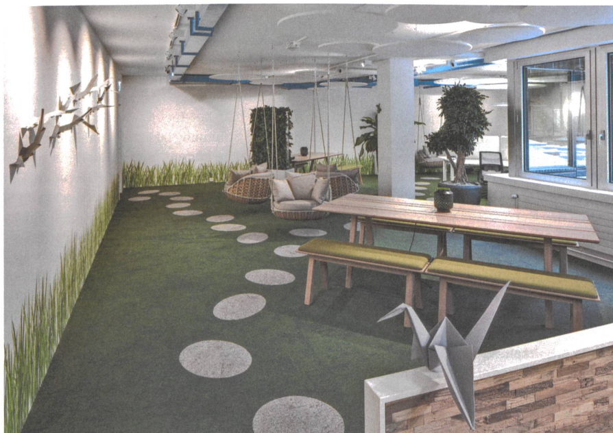
Fast schon wie bei Google: Im «Office Lab» wird ernsthaft gearbeitet und spielerisch Pause gemacht.