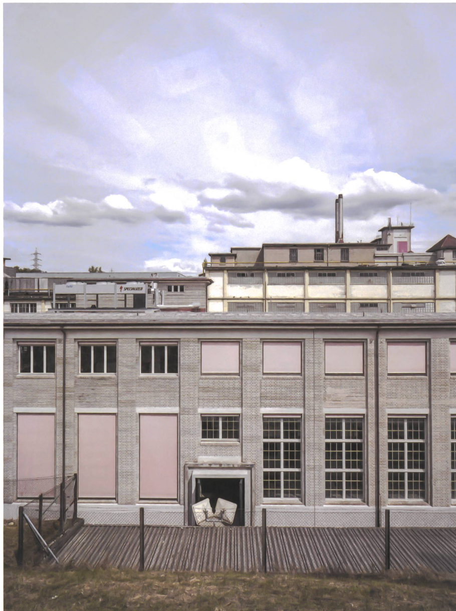
Umgenutztes Werkstattgebäude: Ein guter Anfang ist ein gutes Omen.