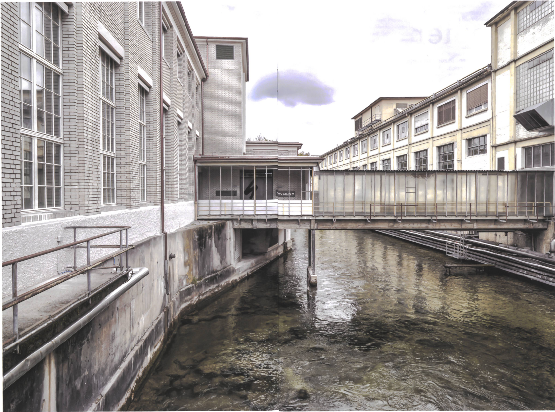
Mehr als 360 Jahre war die Lorze das Herz der Papierproduktion, künftig soll der Fluss das Herz eines lebendigen Quartiers sein.