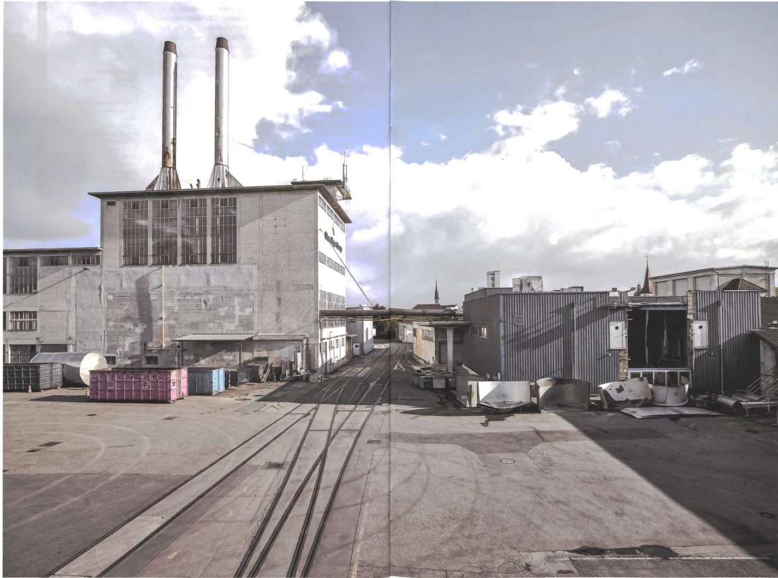
Rundum wird sich vieles verändern, doch das Kesselhaus ist denkmalgeschützt und wird das Areal weiterhin prägen.