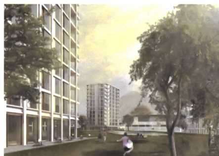
Gassen, Plätze am Wasser und Grünflächen. Visualisierungen: Boltshauser und Albi Nussbaumer.