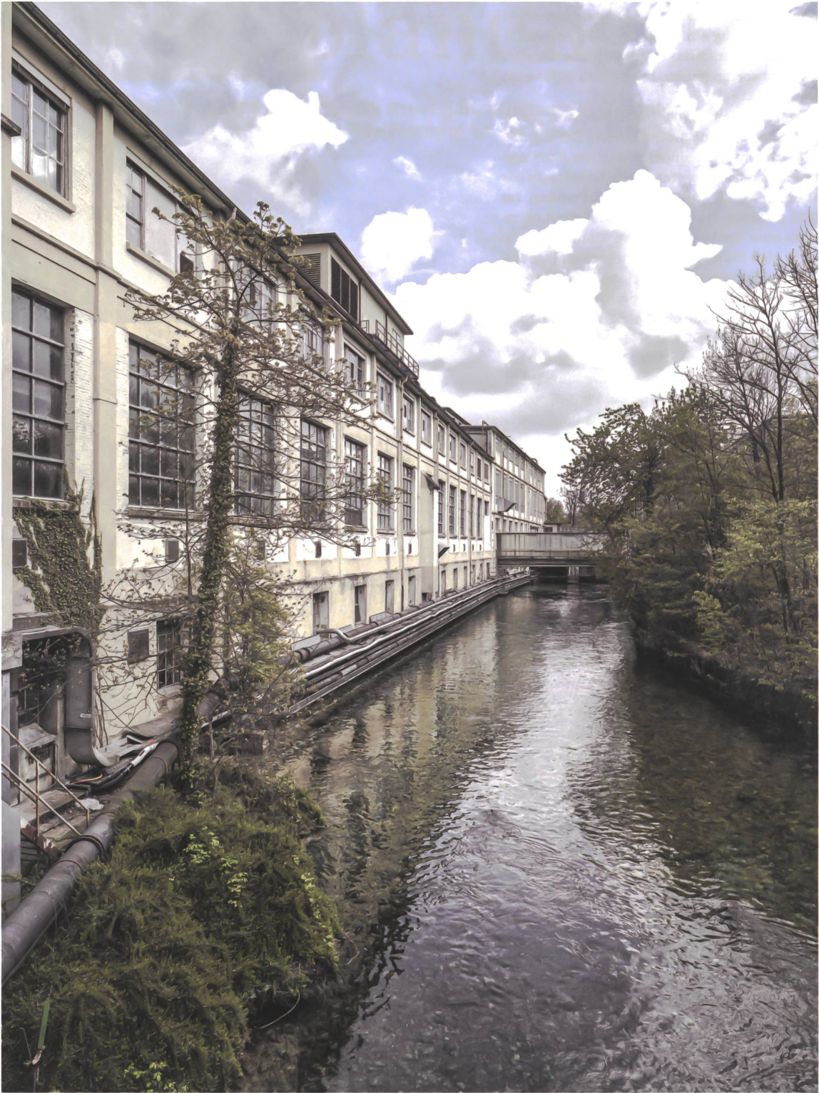
Leben und Arbeiten am Lorzenufer: Noch ist offen, welche Nutzungen in die alten Hallen einkehren.