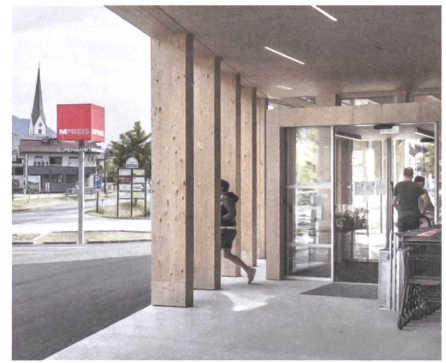
Das Mpreis-Logo verspricht mehr als einen Supermarkt. | The Mpreis logo stands for more than just a supermarket.