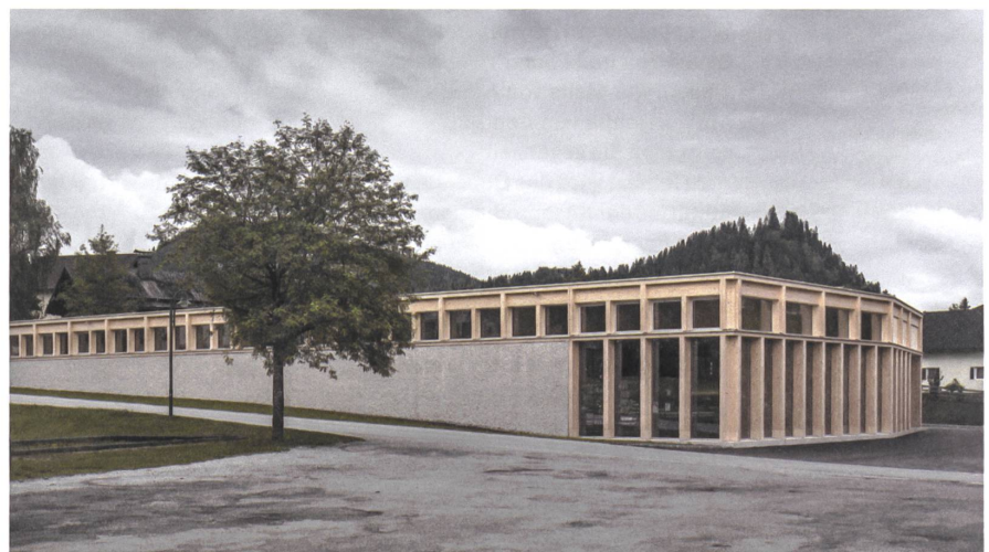
Subtil in den Hang eingefügt. | Discreetly set into the slope.

24 Mpreis Supermarkt | Mpreis supermarket, 2016 2. Preis | 2 nd prize, € 10 000 Dorfstrasse 25, A-St. Martin am Tennengebirge Bauherrschaft | Principals: Mpreis Warenvertriebs GmbH, A-Völs Architektur | Architecture: LP architektur, A-Altenmarkt im Pongau Statik | Structural analysis: Alfred Brunensteiner, A-Natters Bauphysik | Building physics: Fiby, A-Innsbruck Baukosten | Building costs: € 1.4 Mio. Energiekennzahl | Energy key: 41.8 kWh / m 2 a