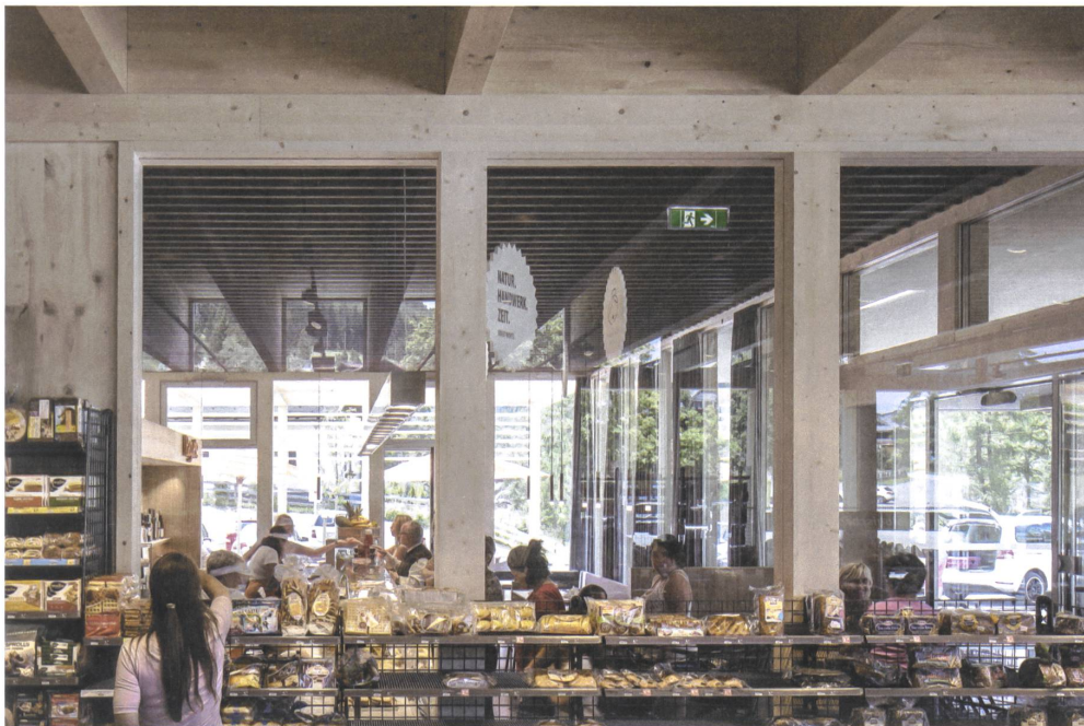
Glas verbindet den Verkaufsraum mit dem Café. | A glass wall connects the shop to the café.