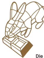
Die Jury sagt