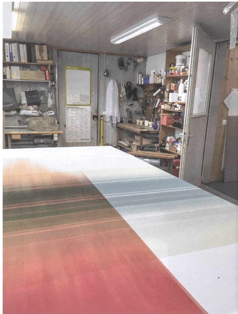
Aus dem Rapport von zwei mal vier Metern entstehen je sechs Panels.