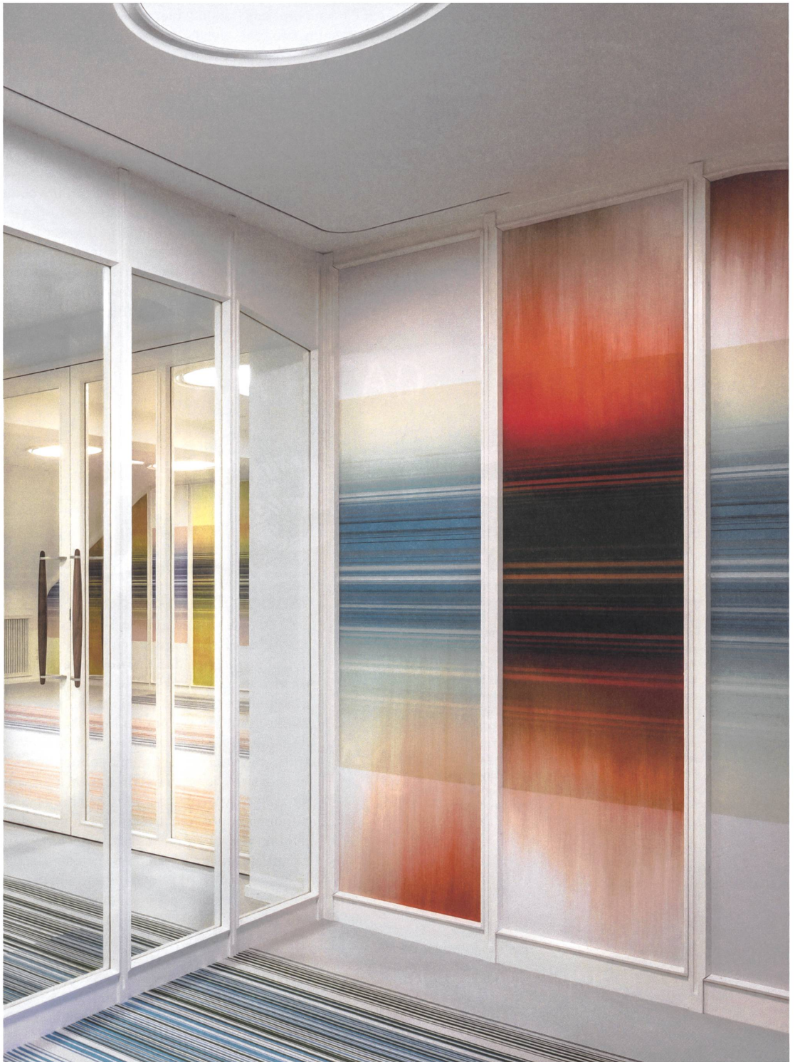
«The Colour Rooms» von Lela Scherrer und Christoph Hefti: Der Farbverlauf symbolisiert das Handwerkliche des Siebdrucks, die präzisen horizontalen Streifen stehen für die Kontinuität des Digitalprints.

Technik freigespielt, ebenso die Wände. Über die denkmalpflegerischen Auflagen hinaus sollte die Gestaltung vor allem die Kompetenz der Schweizer Textilindustrie repräsentieren. Für diese Aufgabe engagierte der Verband Lela Scherrer und Christoph Hefti. Die beiden entwerfen als eigenständige Designer, arbeiten aber immer wieder gemeinsam. Für Swiss Textiles hatten sie bereits die Kleider für das Ausstellungspersonal des Schweizer Pavillons auf der World Expo 2005 im japanischen Aichi entworfen (siehe Hochparterre 11/05) oder letzthin die Uniformen für das Personal des neuen Basler Kunstmuseums von Christ &