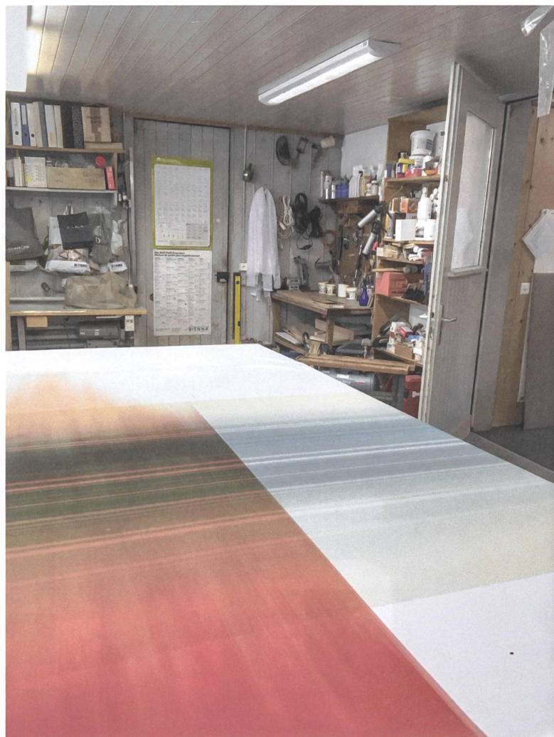
Aus dem Rapport von zwei mal vier Metern entstehen je sechs Panels.