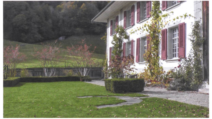
An der Südseite des Hauses reifen Aprikosen und blühen Rosen.