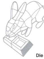
Die Jury sagt