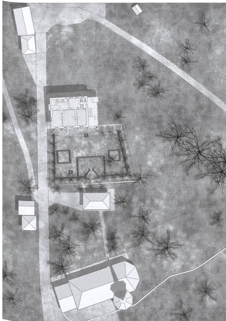
Pfarrhaus und Garten liegen inmitten baumbeständiger Wiesen am Dorfrand von Trub.

Der Bus hält am Löwenplatz in Trub im Emmental. Von dort sind es nur wenige Schritte bis zur Dorfkirche und von da ein kurzer Fussmarsch zum Pfarrhaus. Der Platz mit seinen grossstädtischen Dimensionen und die beiden mächtigen Bauten setzen einen Kontrapunkt zur Umgebung mit bewaldeten Hügeln und Bauernhäusern. Zwischen Kirche und Pfarrhaus liegt ein Garten. Auch er ist stattlich. Über dem hölzernen Gartenzaun leuchtet der Besucherin das Rot herbstlicher Sträucher entgegen.