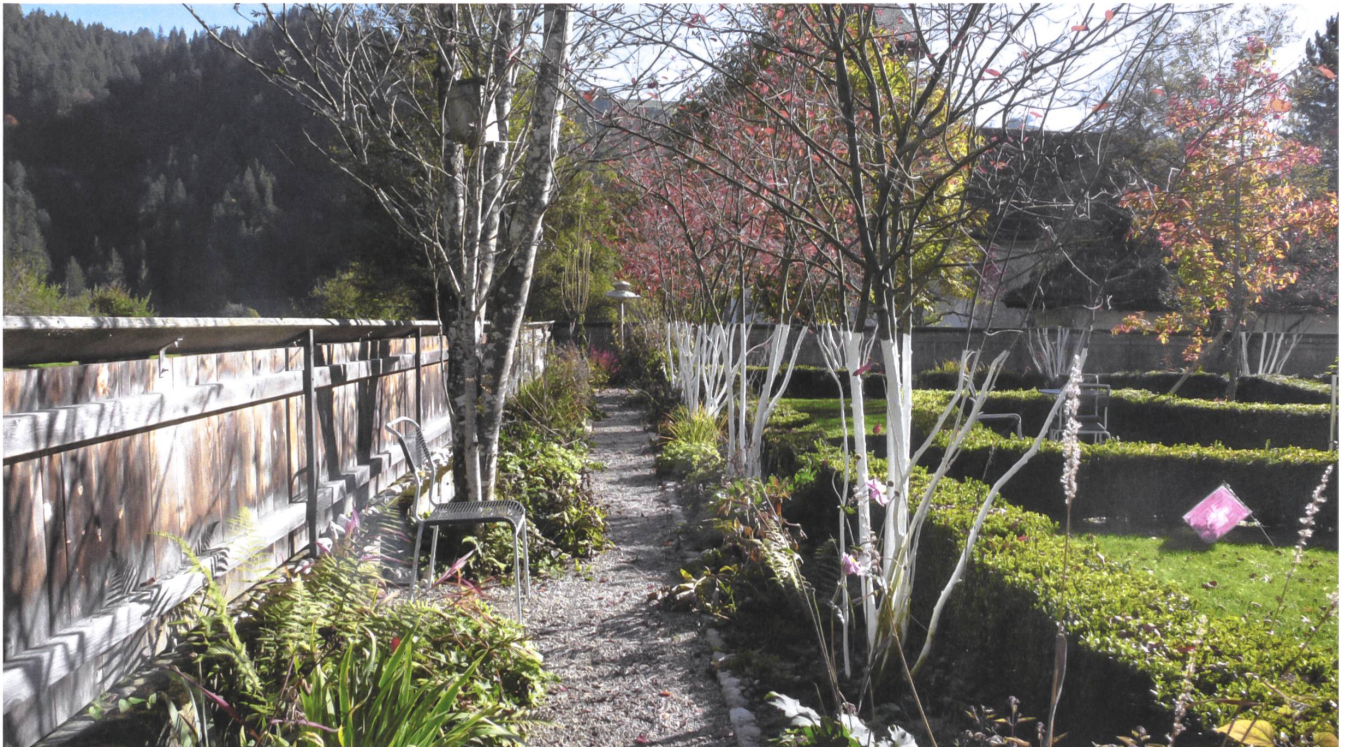
Garten vor dem ehemaligen Pfarrhaus in Trub: Der Bretterzaun umschliesst das Kleinod, in seinem Schutz blühen Stauden.

Text: Claudia Moll