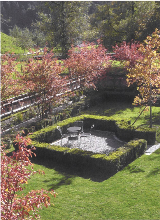
Der Sitzplatz im barockisierenden Parterre.