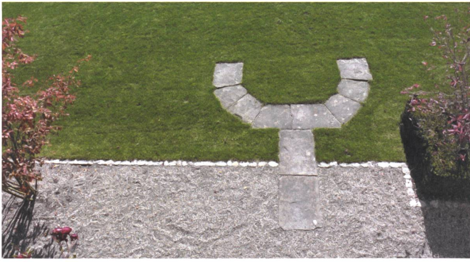
Das Symbol Plutos führt vom Pfarrhausgarten in den Sternenhimmel und zurück.