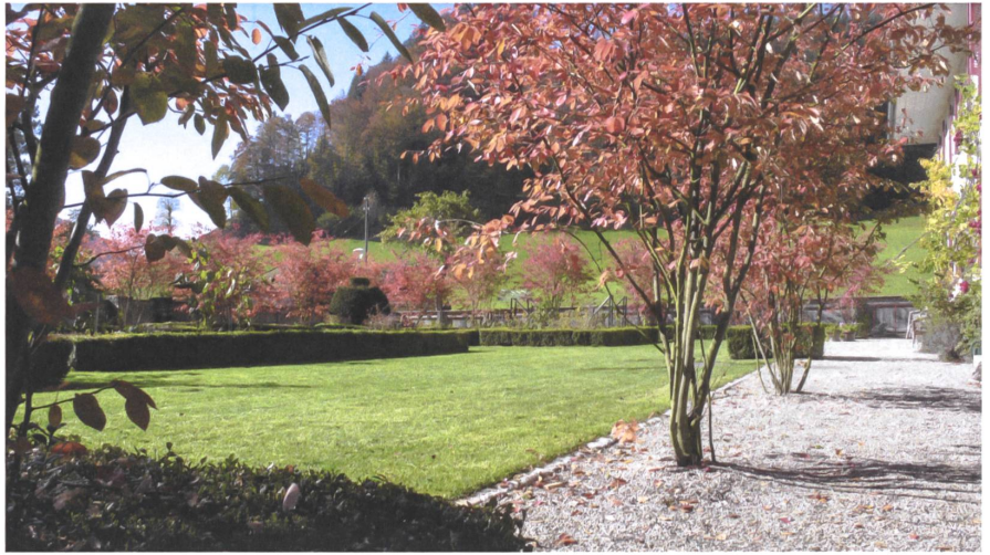
Das kräftige Rot der Felsenbirnen prägt den Garten im Herbst.