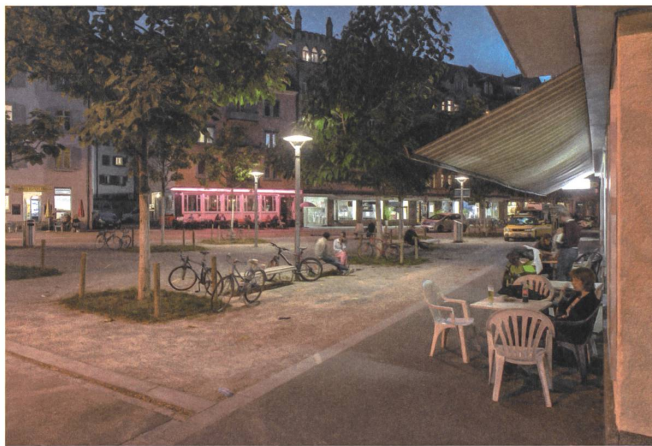
Wo früher der Verkehr mitten durch Zürich-Wiedikon brauste, treffen sich die Anwohner heute auf neu gestalteten Plätzen.