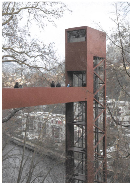
Ein Lift verbindet den Bahnhof Baden AG mit dem Limmatufer und über eine Brücke mit Ennetbaden.