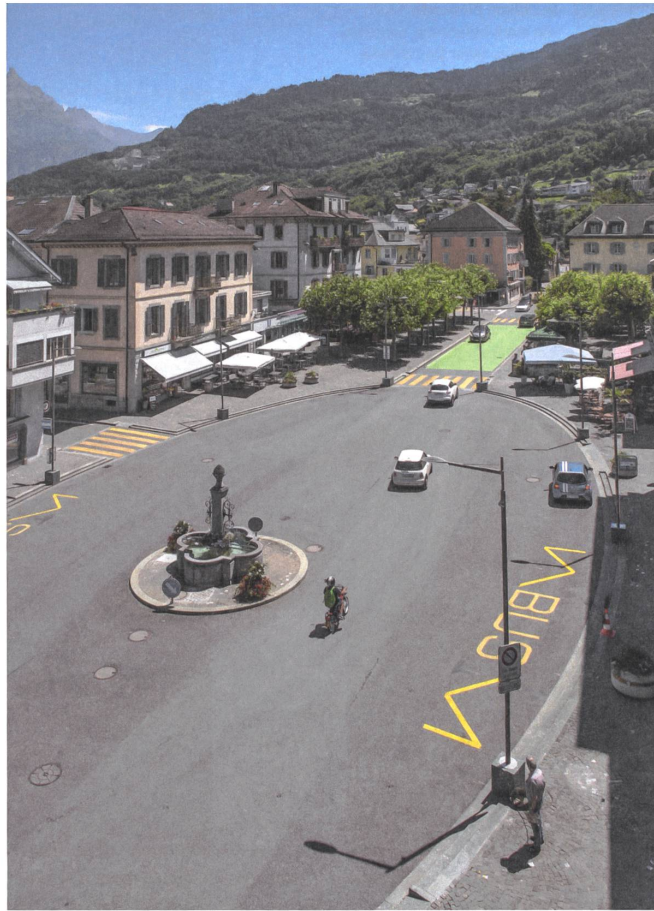
Eine beispielhafte Planung: die Place Centrale in Monthey VS.

in den bereits früher vom motorisierten Verkehr befreiten Stadtkern und durfte ab Anfang der 1990er-Jahre nur noch von Bussen und vom Anlieferungsverkehr befahren werden. Der Strassenraum wurde von Fassade zu Fassade neu gestaltet, ein Bach ans Licht geholt. Wo früher der Verkehr dominierte, entstand eine attraktive Flaniermeile. Die Neuenburger Fussgängerinnen und Fussgänger erhielten einen Teil ihrer Stadt zurück.