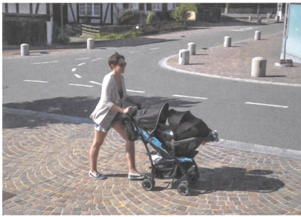
In Uitikon ZH wurde die stark befahrene Verkehrsachse zu einer Dorfstrasse zurückgebaut. Ursprünglich war die Fahrbahn gepflästert.