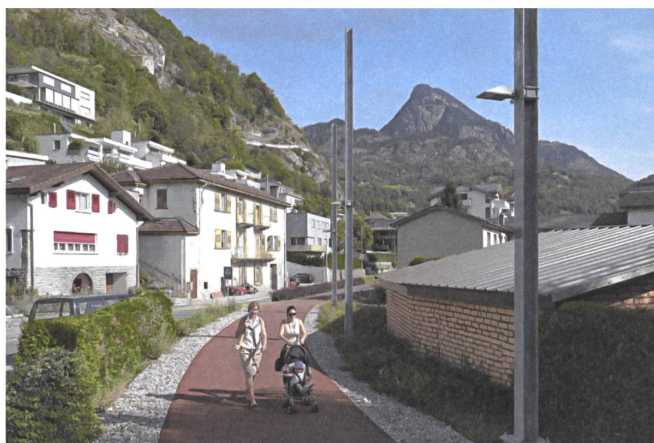
Auf dem ehemaligen Trasse der Furka-Oberalp-Bahn spaziert man heute quer durch Naters VS.