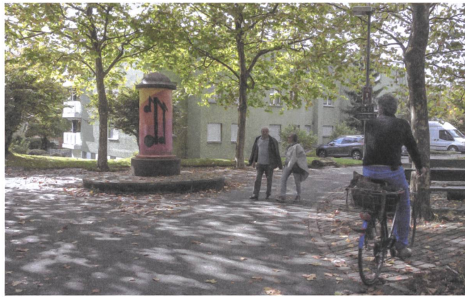
Einer der ersten Preise ging vor dreissig Jahren nach Widen AG: Die Erschliessung des Wohnquartiers ist bis heute vorbildlich.