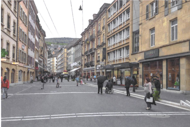
In Neuenburg hat man die Rue du Seyon von Fassade zu Fassade neu gestaltet; ein Bach verläuft wieder unter freiem Himmel.