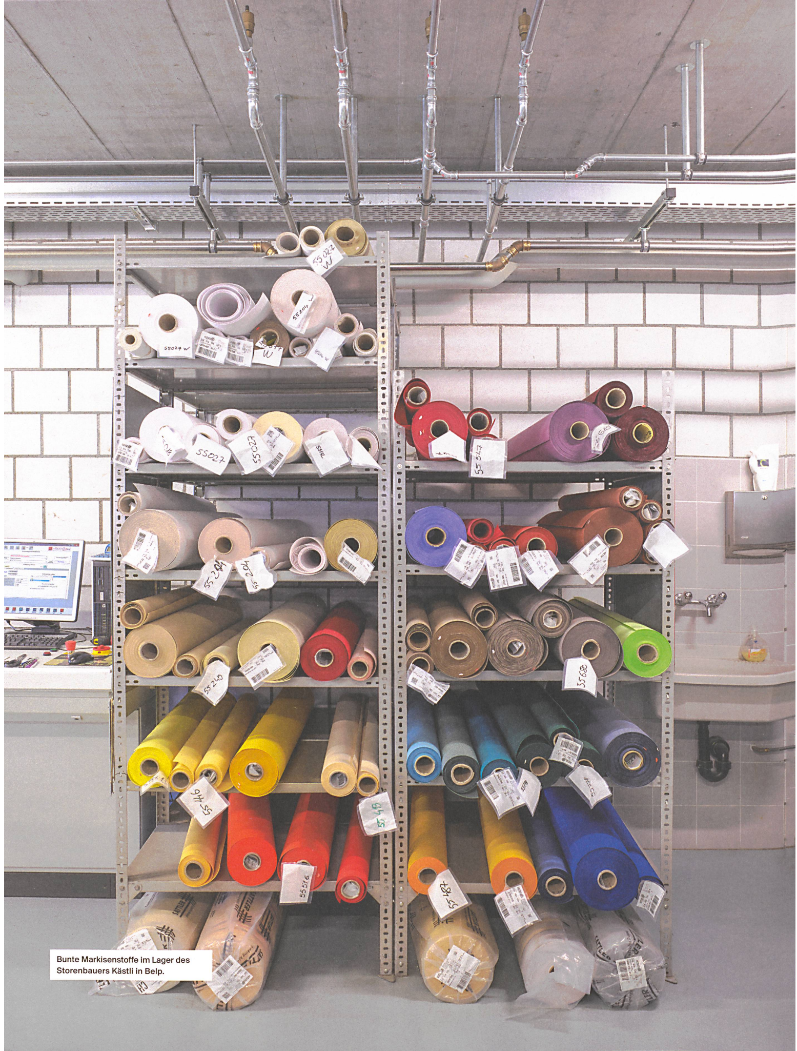
Bunte Markisenstoffe im Lager des Storenbauers Kästli in Belp.