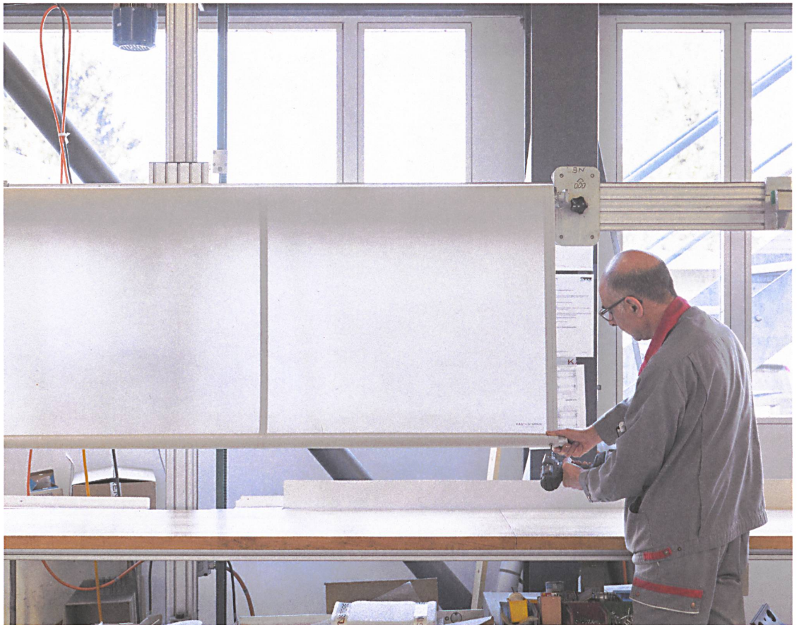
Eine Stoffwalze aus Stahl wird in eine Maschine geklemmt, der Stoff wird eingeführt, und ein Motor wickelt schliesslich die Store auf.