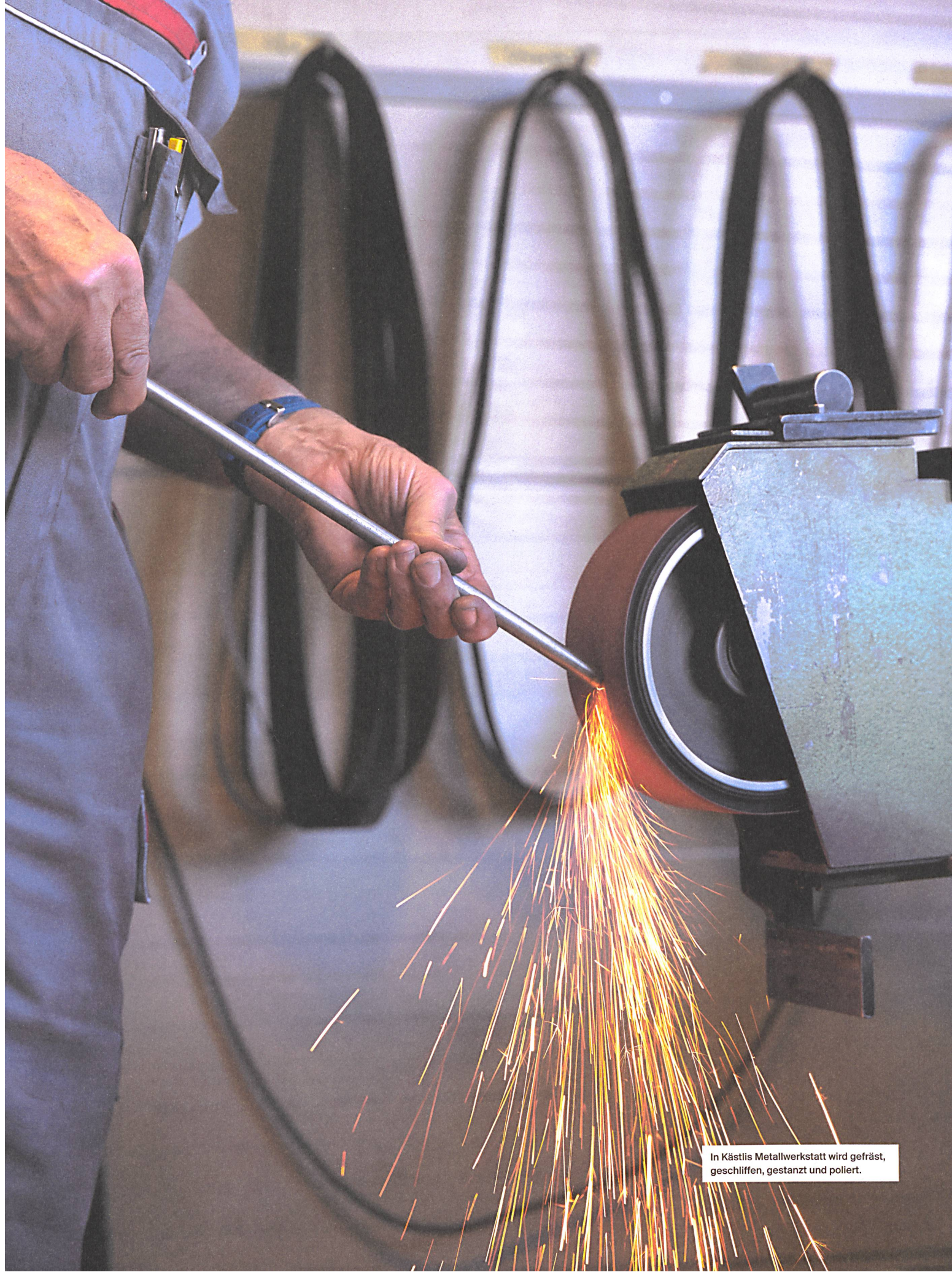
In Kästli's Metallwerkstatt wird gefräst, geschliffen, gestanzt und poliert.