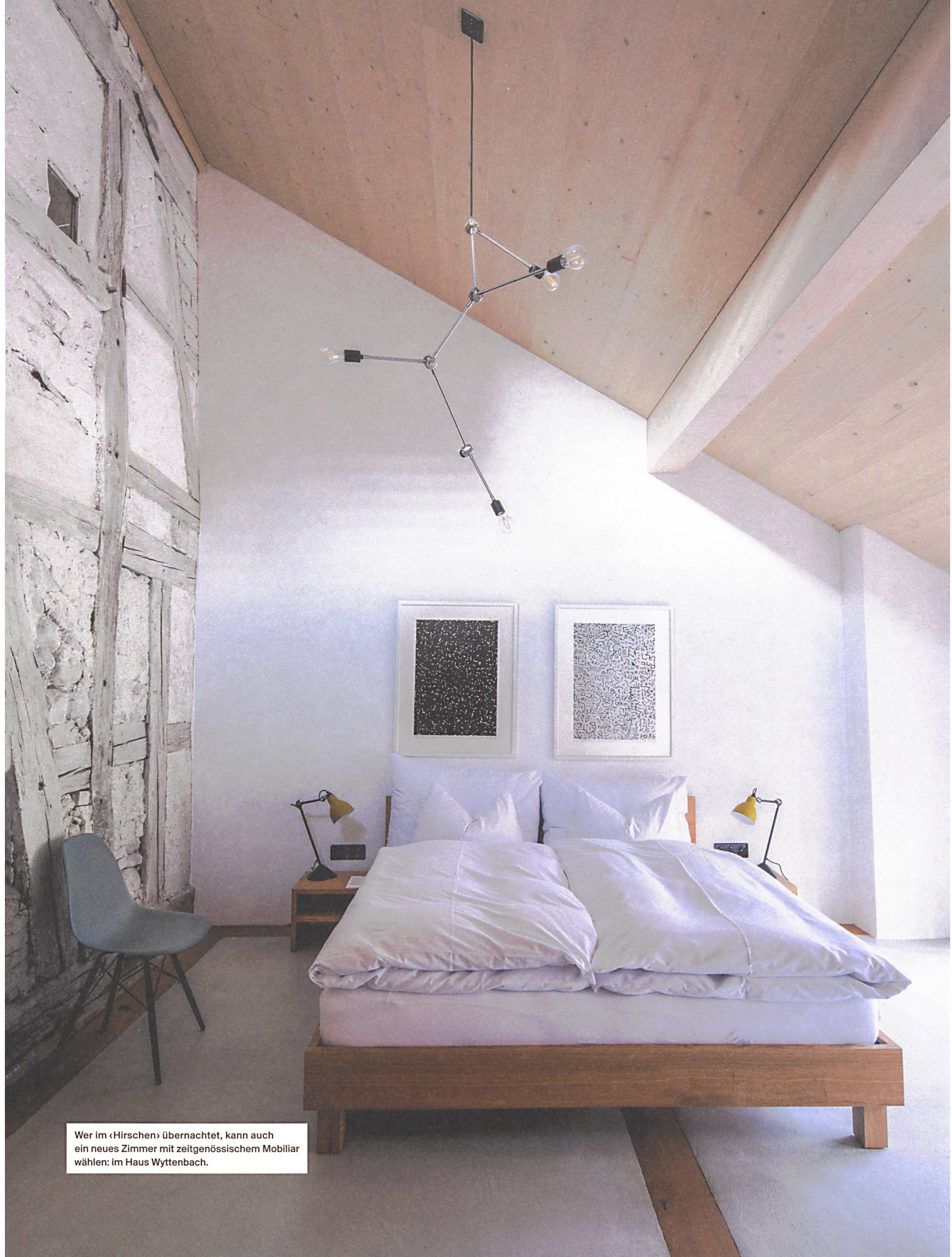
Wer im «Hirschen» übernachtet, kann auch ein neues Zimmer mit zeitgenössischem Mobiliar wählen: im Haus Wyttbach.