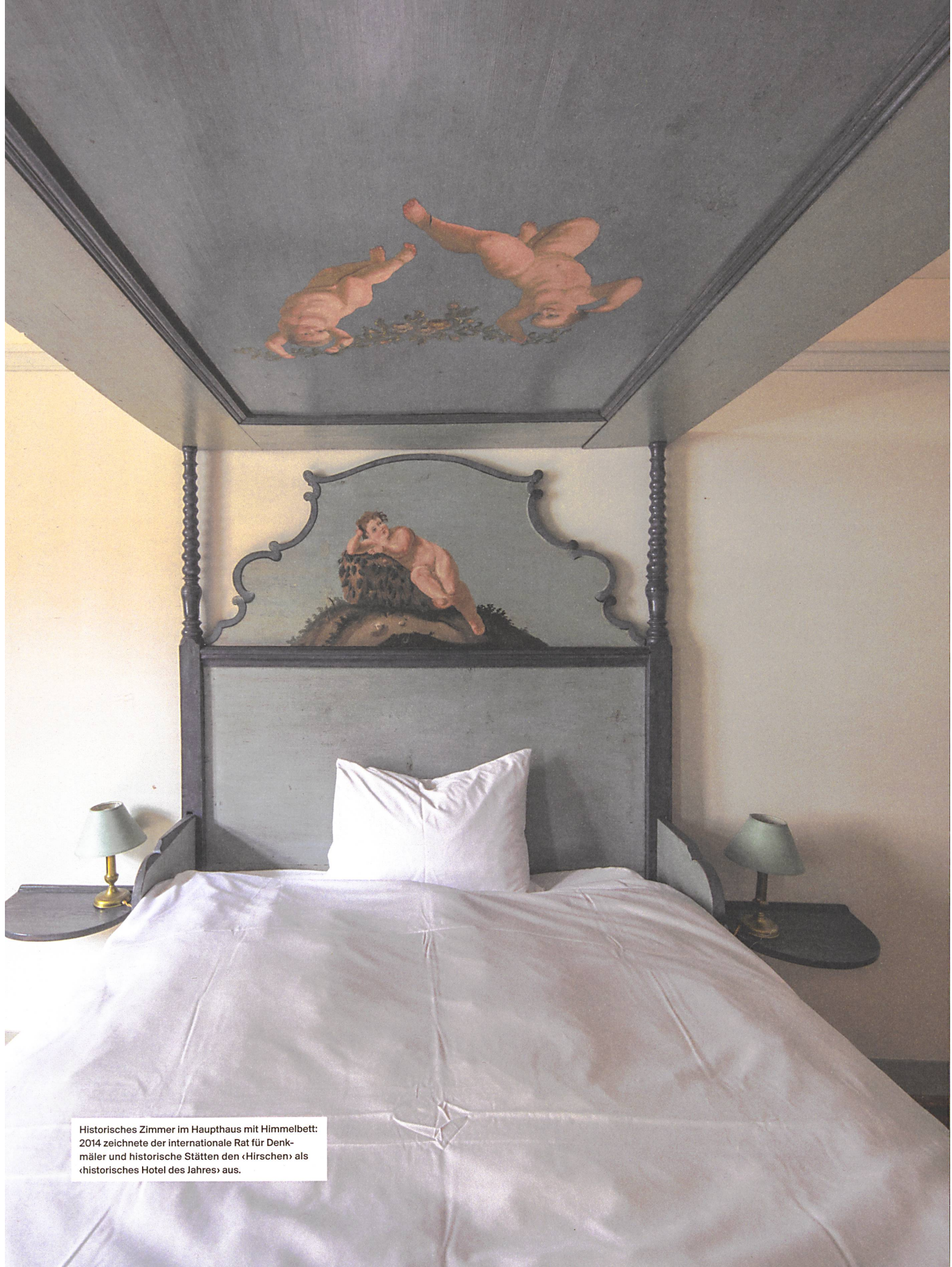
Historisches Zimmer im Haupthaus mit Himmelbett: 2014 zeichnete der internationale Rat für Denkmäler und historische Stätten den «Hirschen» als «historisches Hotel des Jahres» aus.