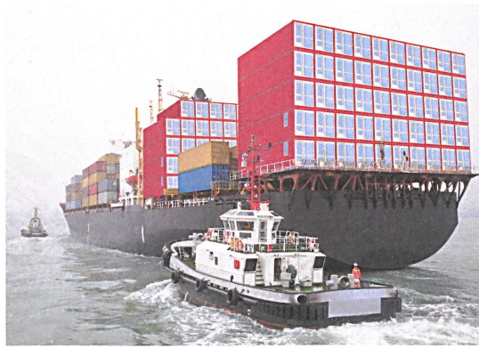
Zum Wohnen umgerüstete Frachtcontainer auf dem Weg von China zurück nach Amsterdam für das Projekt «Keetwonen».

In Amsterdam fehlten Anfang der Nullerjahre Wohnungen für Studierende. Die Firma Tempohousing liess gut tausend gebrauchte Frachtcontainer umrüsten, die Stadt kaufte sie und stellte sie ab 2005 auf eine drei Hektar grosse Brache. Ein Container mit 28 Quadratmetern Fläche, Küche und Bad kostete 400 Euro pro Monat. Fünf Jahre sollten sie stehen, blieben aber bis heute. Erst jetzt werden 250 Module abtransportiert und die restlichen voraussichtlich 2021, wenn das Grundstück bebaut werden soll. «Doch wie jede Planung kann sich auch diese ändern», meint Tempohousing.