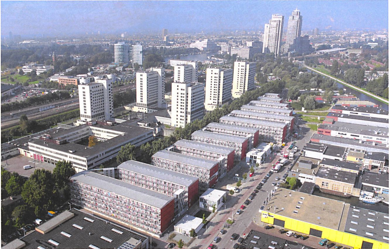
«Keetwonen» in Amsterdam: Ergänzt mit Cafés, Gemeinschaftsräumen und Waschsälons in weissen Containern entstand ein Studentenquartier auf Zeit.