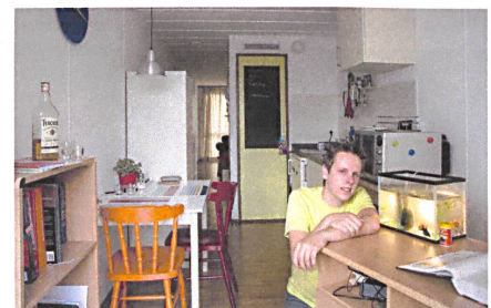
Das Bad-Kabäuschen zioniert den Container. Hier kochen, essen, arbeiten, dort ruhen und schlafen.