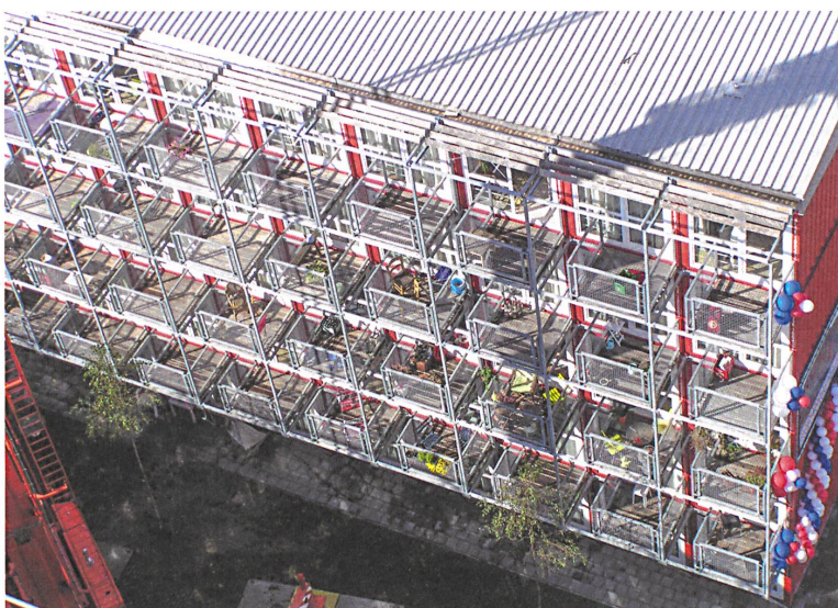
Günstige Wohnburg mit einem Balkon pro Wohnung.