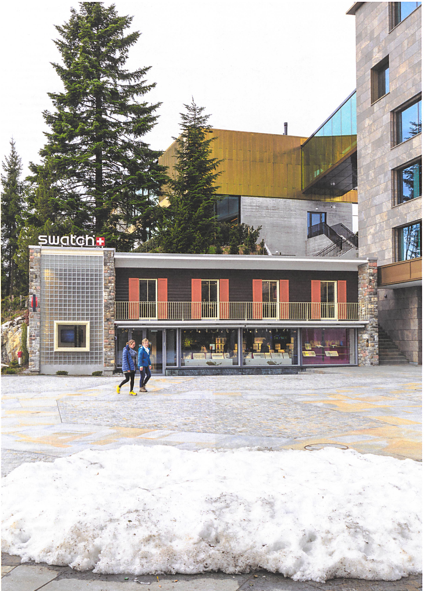
Die Architektur sublimiert das Vorgefundene an Stilen, Materialien und gelegentlichen historischen Bauteilen zu einem Wellnessgemisch von Neutralität und Opulenz.