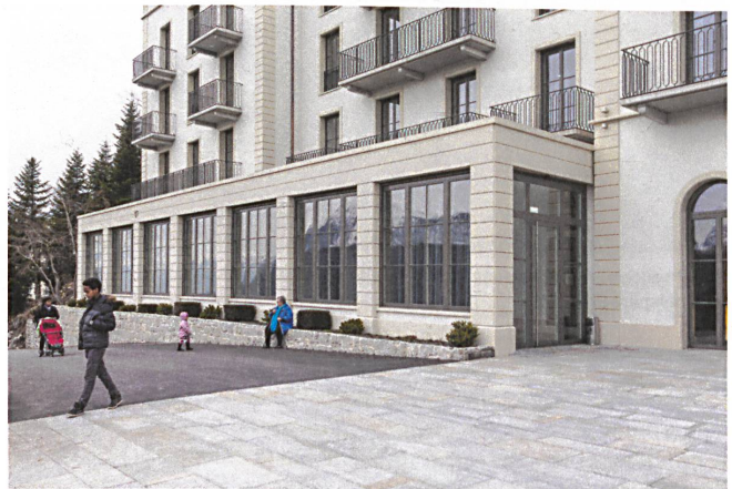
Die Details am Sockel des Palace-Hotels auf dem Bürgenstock sind kaum sorgfältiger ausgeführt, als es am Hang von Ennetbürgen der Fall wäre.