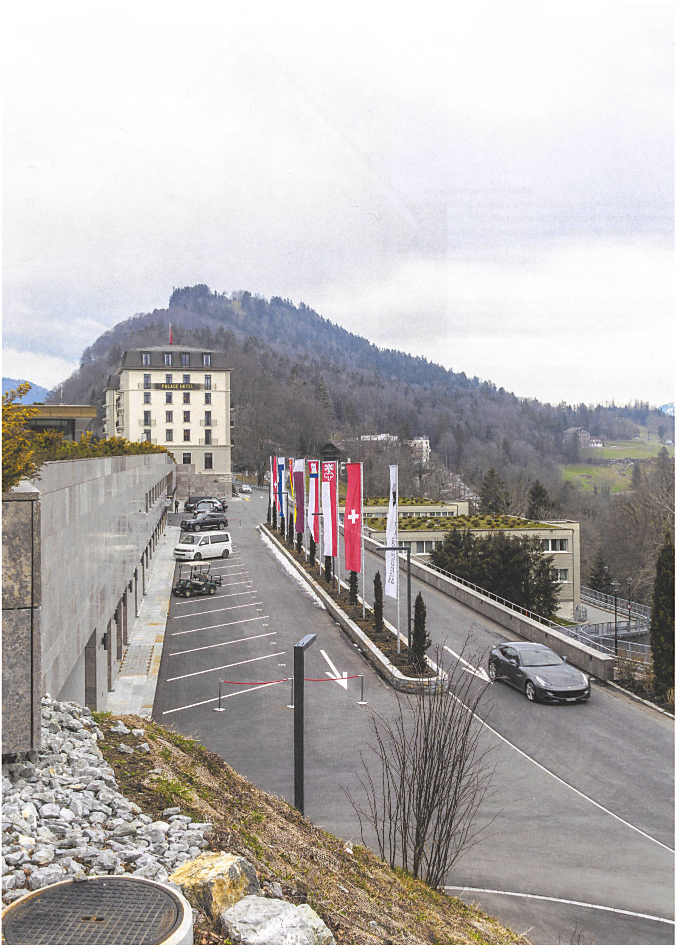
Könnte auch die Anlieferung eines Flughafens sein: eine schein-massive Stützmauer der erneuerten Hotelanlage auf dem Bürgenstock bei Luzern.