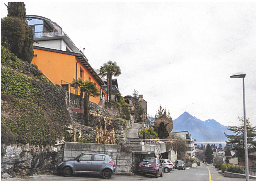
Stützmauern und Garagen am Ennetbürger Hang: Die Strasse interessiert keinen als Ort. Selbst die Eingänge werden architektonisch nicht behandelt.