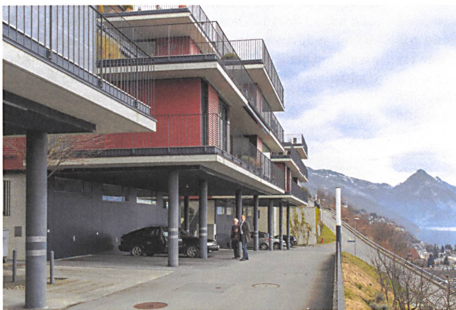
Es geht auch ohne Stützmauer. Das ergibt gleich eine offenere, angenehmere Stimmung.