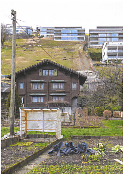
Eklatant egoistische Aussichtshaltung.