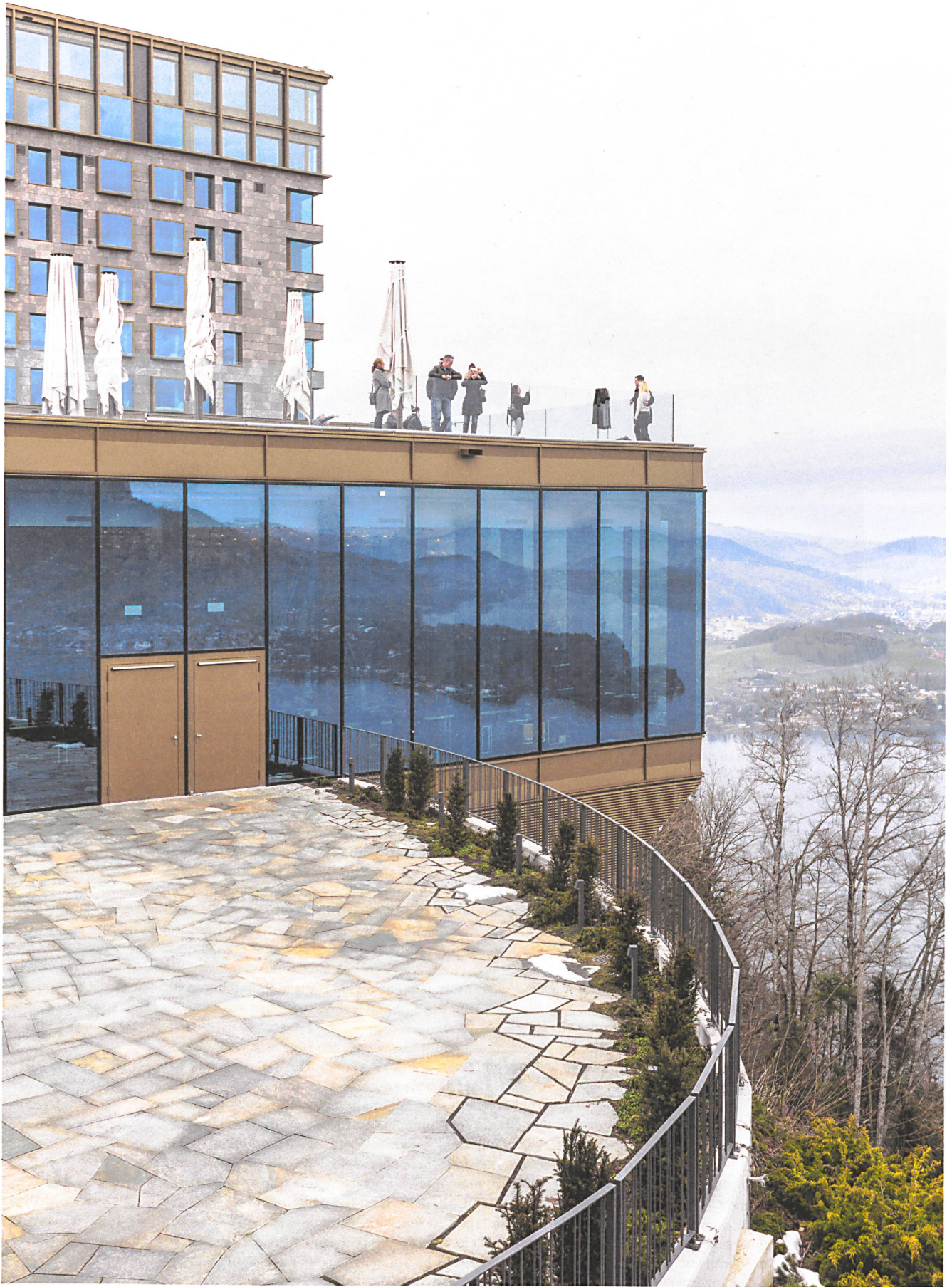
Dem Architekturliebhaber entgeht auf dem Bürgenstock nicht das Bemühen, dem Hotelneubau so etwas wie eine architektonisch durchgebildete Krone aufzusetzen.