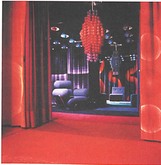
Für Mira-X entwickelte Verner Panton ein Baukastensystem, das auf fünf Pfeilern basiert: Farben, Formen, Helligkeiten, Kolorite und Größenverhältnisse. Hier Bilder des ersten Messestandes für die Frankfurter Heimtex im Jahr 1970.