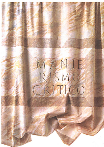
H-Design – Trix und Robert Haussmann sowie Alfred Hablützel – setzten für ihre Textilien auf kritischen Manierismus und arbeiteten illusionistisch mit Motiven aus der Architekturgeschichte.