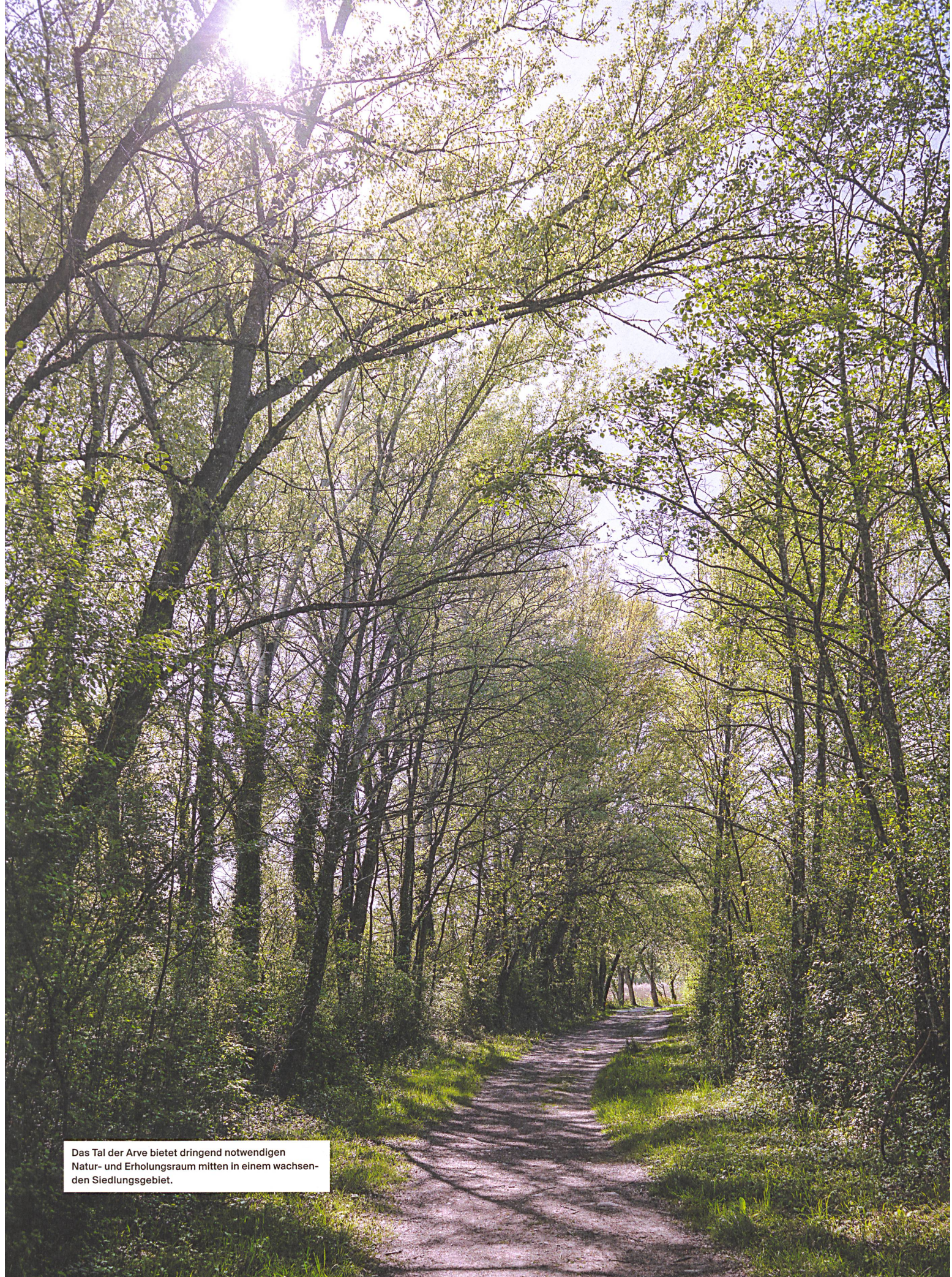
Das Tal der Arve bietet dringend notwendigen Natur- und Erholungsraum mitten in einem wachsenden Siedlungsgebiet.