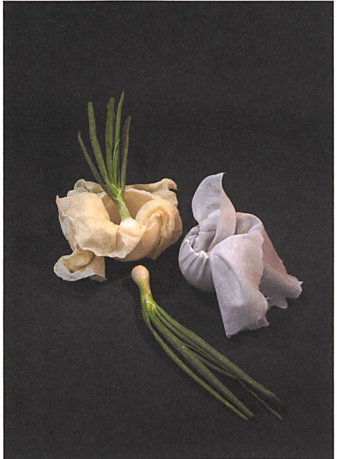
Die Objekte von Atelier Volvox: In warmes Bienenwachs getauchte Baumwolltücher werden, erkaltet, zu fragilen Gefäßen.