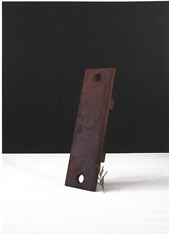
Othmar Prener experimentiert mit Materialien, auf denen für gewöhnlich keine Speisen serviert werden, hier mit rostigem Stahl.

Text: Lilia Glanzmann