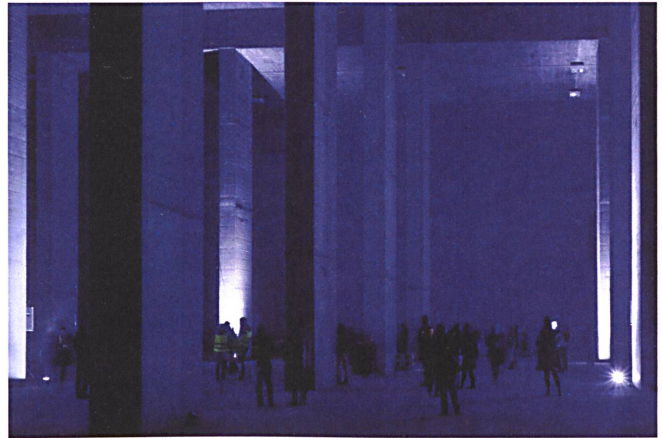
Im ehemaligen Hochregallager der PTT in Bern, 21 Meter unter der Erde, findet am 20./21. Oktober der «Steinbeisser»-Anlass statt.