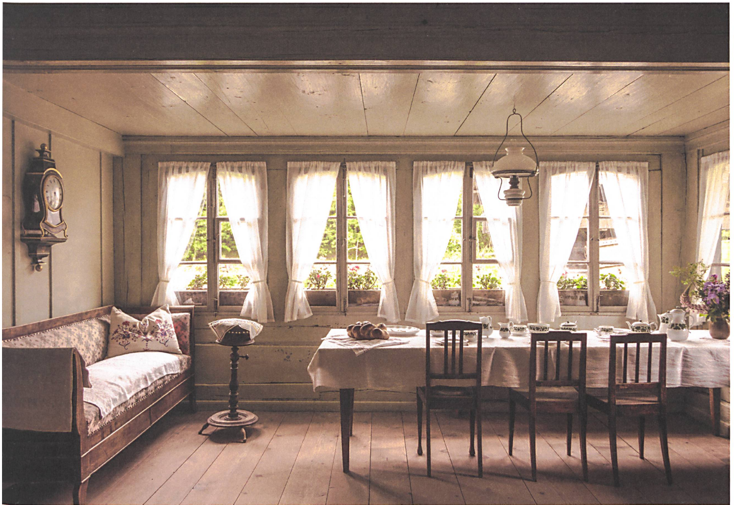
Im Bauernhaus von Ostermundigen auf dem Ballenberg: Zopf und Kaffee stehen auf dem Tisch, die Bäuerin wartet vor dem Haus auf Christen und seine Eltern, den ihrem Vreneli versprochenen Bräutigam.