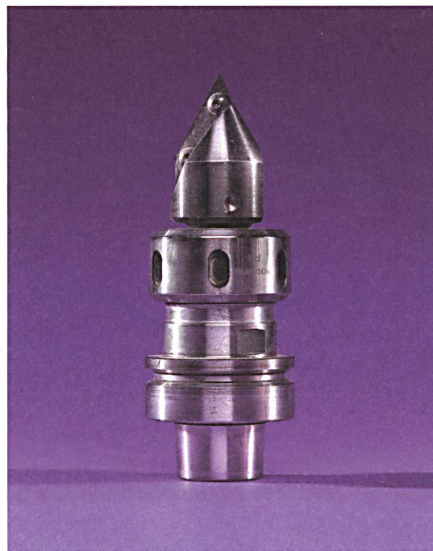
Spitzfräser | Fraise pointue | Fresa a punta