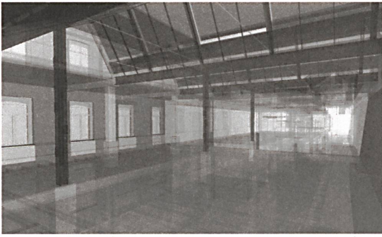
Umbau, Renovation mit Nutzungsänderungen, 2018 Lessingstrasse 11-17, Zürich Bauherrschaft: ZürichParis, Zürich Architektur: OOS Architekten, Zürich Projektorganisation, Baumanagement: Righetti Partner Group, Zürich Anlagekosten: ca Fr. 10 Mio.