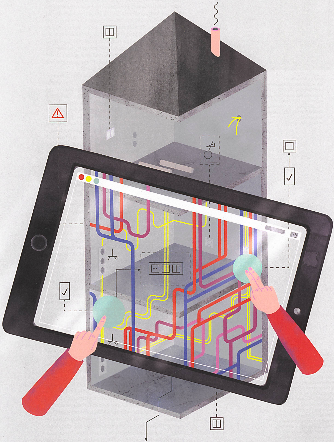
Auf der Baustelle dient das Tablet als Online-Planarchiv, Checklisten-Organizer, Terminkalender, Fotoapparat, Bestellterminal oder «Röntgengerät».