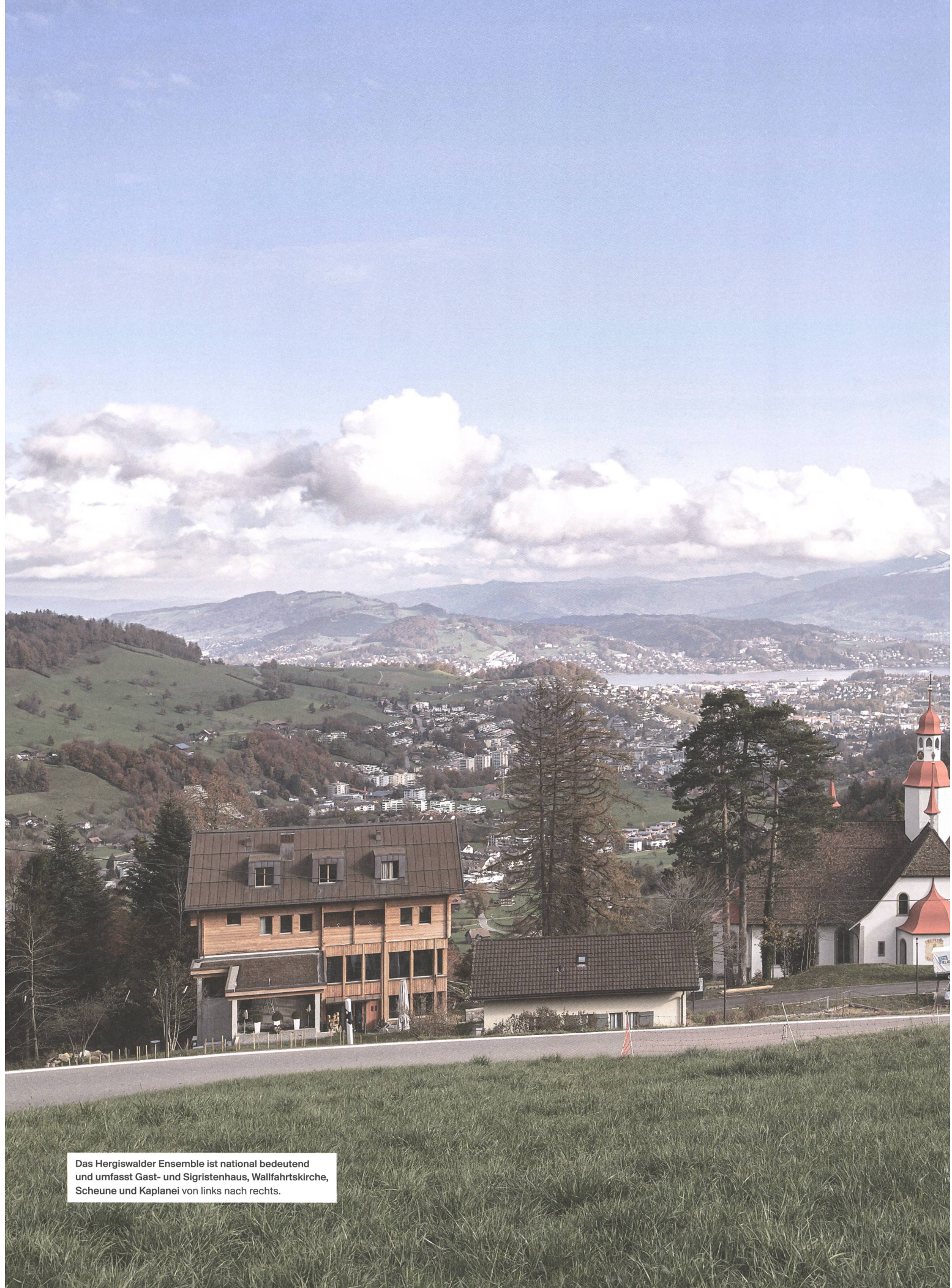
Das Hergiswaller Ensemble ist national bedeutend und umfasst Gast- und Sigristenhaus, Wallfahrtskirche, Scheune und Kaplanei von links nach rechts.