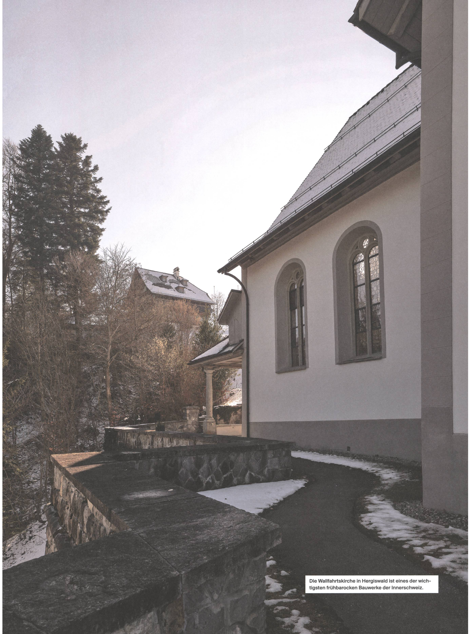
Die Wallfahrtskirche in Hergiswald ist eines der wichtigsten frühbarocken Bauwerke der Innerschweiz.