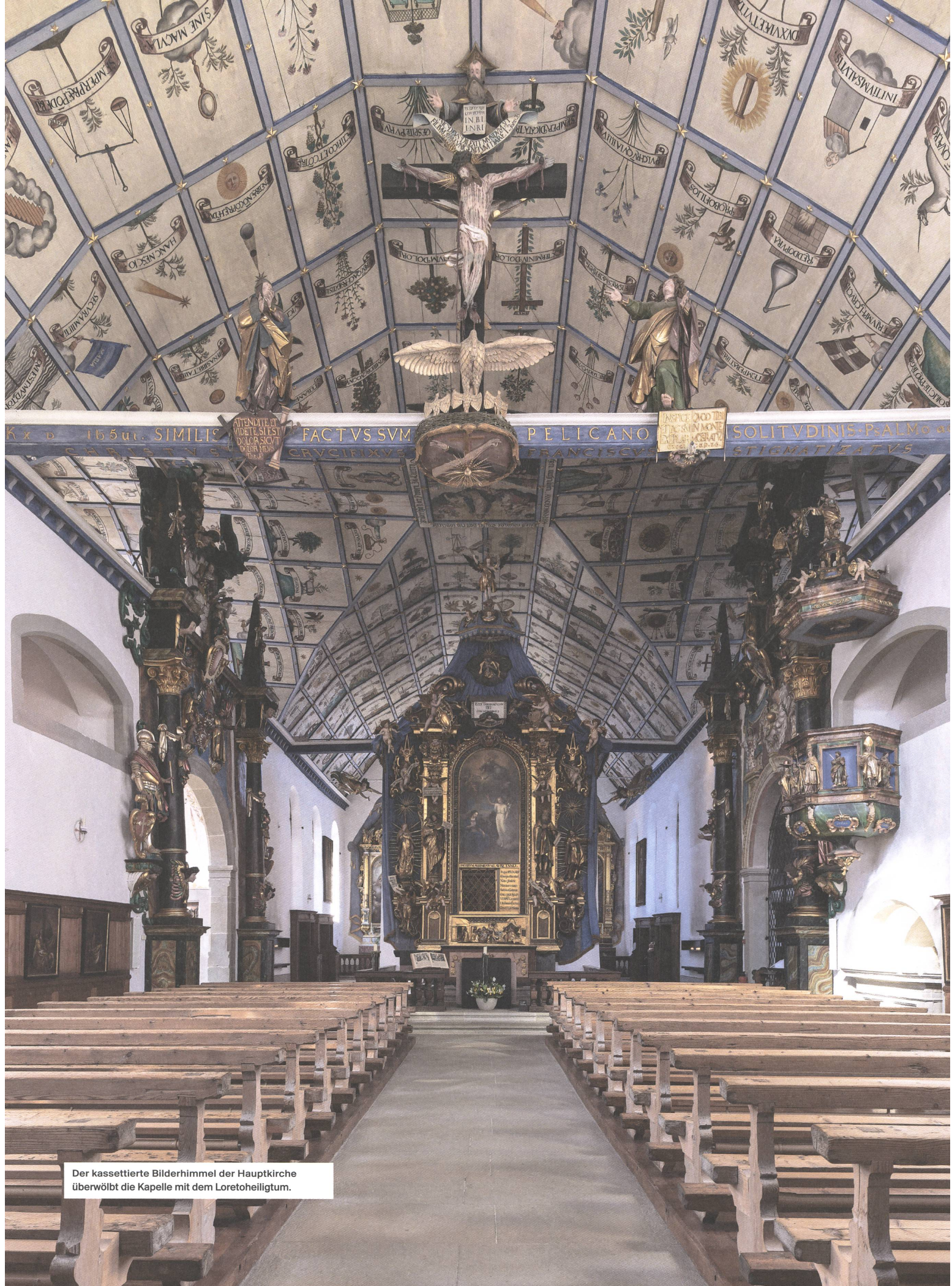
Der kassettierte Bilderhimmel der Hauptkirche überwölbt die Kapelle mit dem Loretoheiligtum.