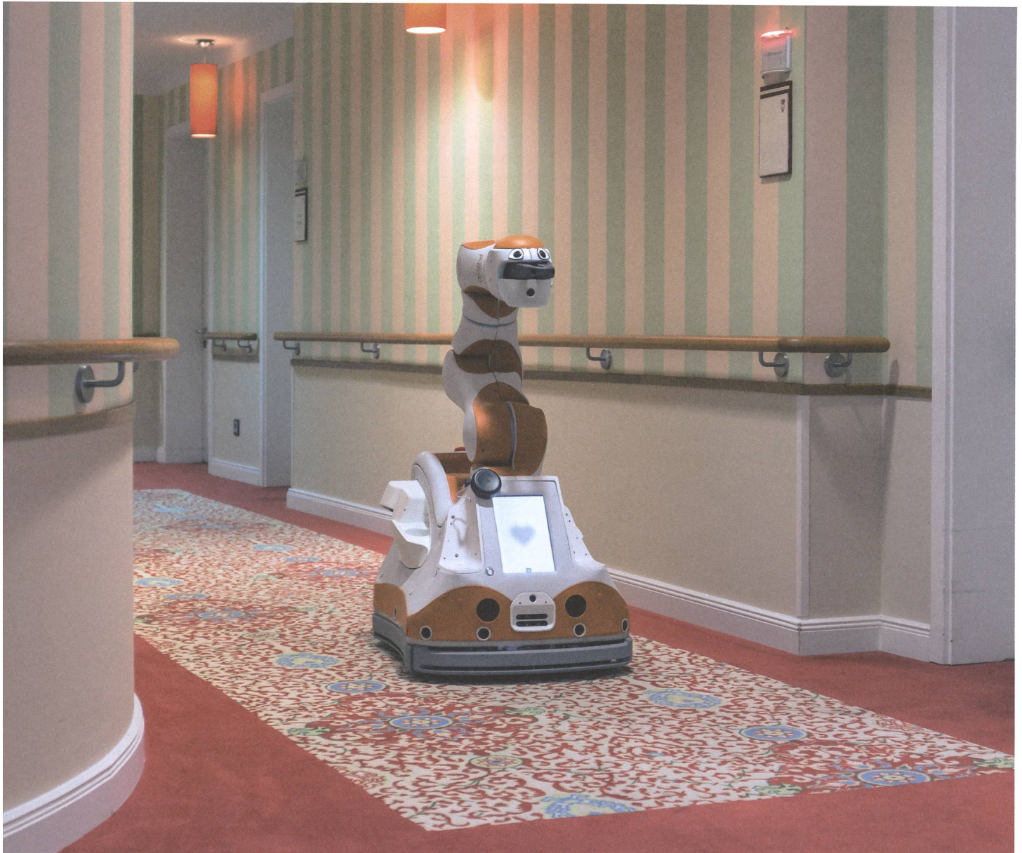
Assistenz- und Pflegeroboter Lio bewegt sich autonom durch die Gänge von Alters- und Pflegeheimen und schaut uns mit den aufgeklebten Augen freundlich an.

schungsprojekten auch, untersucht man dabei, ob und wie Assistenzroboter für die Pflege eingesetzt werden können. Vollständig automatisiert wird die Pflege wohl nie, sind sich Fachleute einig. Doch richtig eingesetzt, versprechen sie Entlastung. Die Angst vor einer automatisierten, entmenschlichten Pflege verliert, wer zuschaut, wie schwierig es für den Roboter ist, menschliches Verhalten vorauszusehen. Und erfährt, wie aufwendig es ist, einen Roboter wie Lio zu entwickeln und zu bauen.