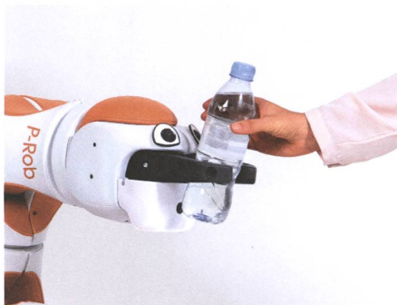
Der mobile Roboter Lio verteilt zum Beispiel Wasser an Pflegebedürftige.