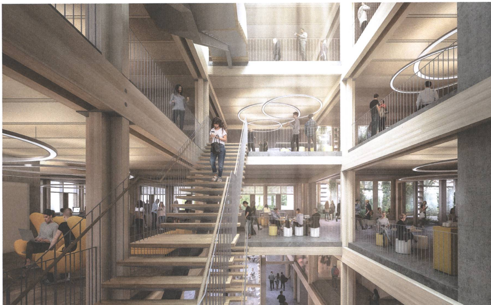
Das Smart Living Lab, das bis 2023 in Freiburg entsteht, soll das klimaverträgliche Bauen voranbringen.