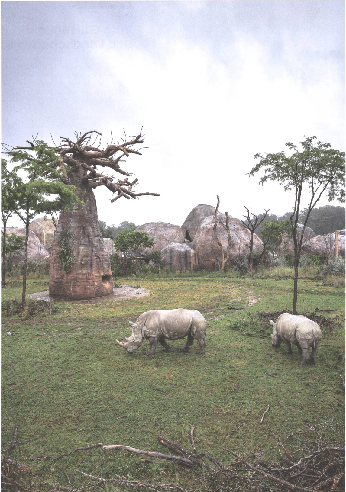
Künstliche Natur: Die Lewa-Savanne im Zoo Zürich haben Vetschpartner Landschaftsarchitekten dem kenianischen Original nachempfunden, inklusive Affenbrotbäume aus Stahl und Beton.