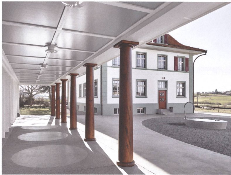
1 Schulhaus Seedorf: Blick von der Laube über den Pausenhof zum Altbau.