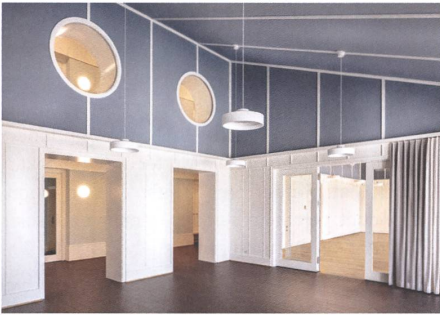
1 Entrée.