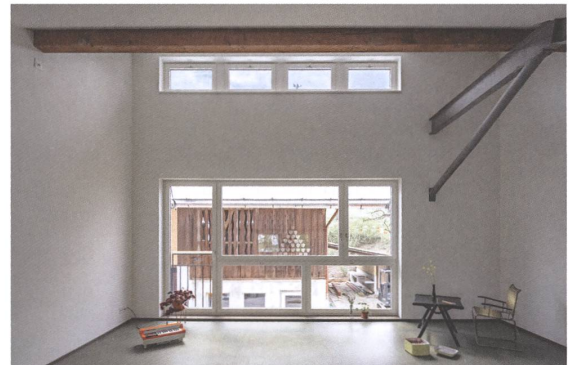
3 Pragmatischer Weiterbau.