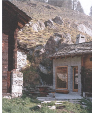
2 Unterm Granit: Maiensäss in Arolla.