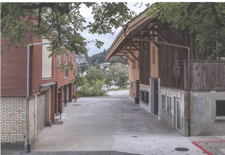
3 Umnutzung eines bäuerlichen Ensembles in Horgen mit Remise (links) und Scheune (rechts).