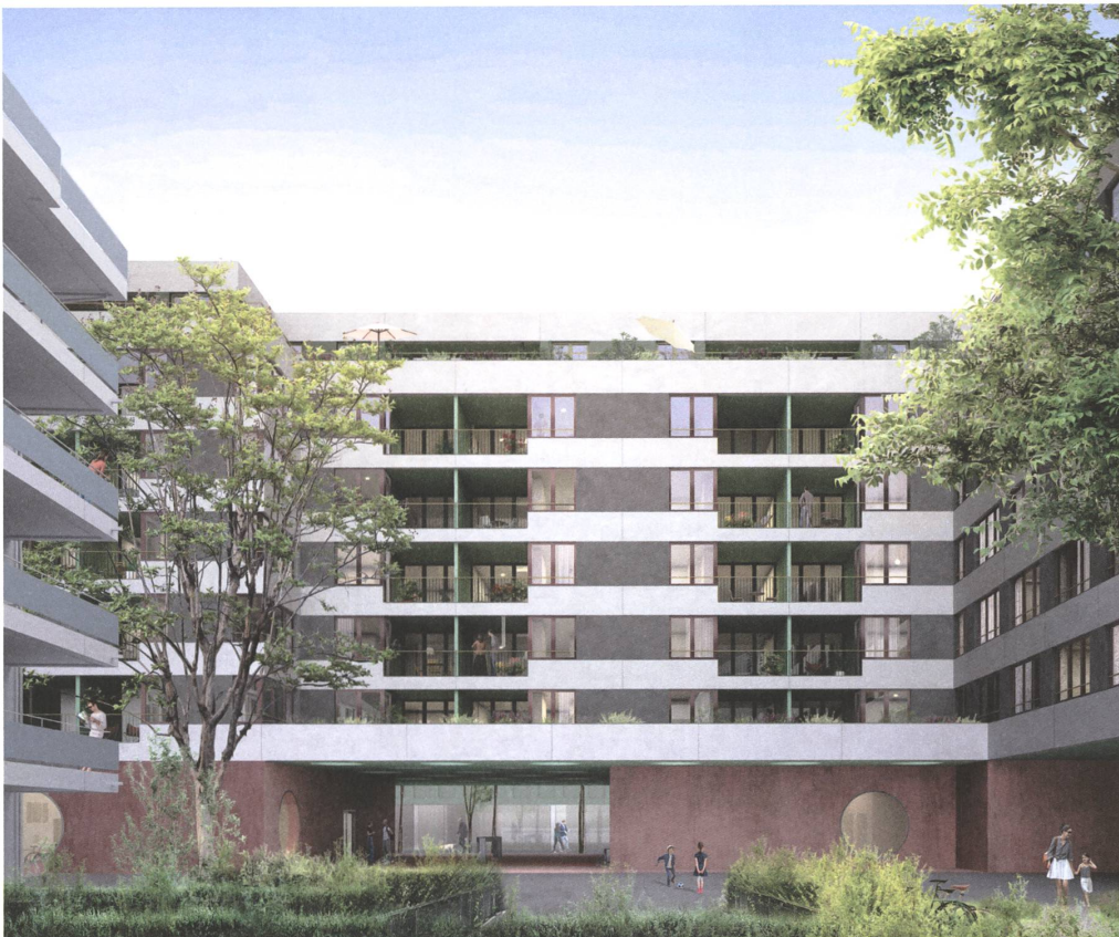
Arealentwicklung Tribtschen in Luzern von Carus St John: War die Überarbeitung notwendig?

→ erwähnte Bürogebäude ist ein weiteres Gegenüber. Entstehen sollen neu gemäss Wettbewerbsvorgabe Wohnungen mit USP (Unique Selling Proposition) sowie Verkaufsflächen und Gewerbenutzungen gegen die Strasse. Vorabklärungen zum Baugrund, zu den Grundwasserströmen, zur Parkierung und zur möglichen Etappierung liegen vor, ebenso volumetrische Studien. Die Entwickler von HRS bezeichnen die Aufgabe wegen der Lage und der gewünschten Dichte als komplex.