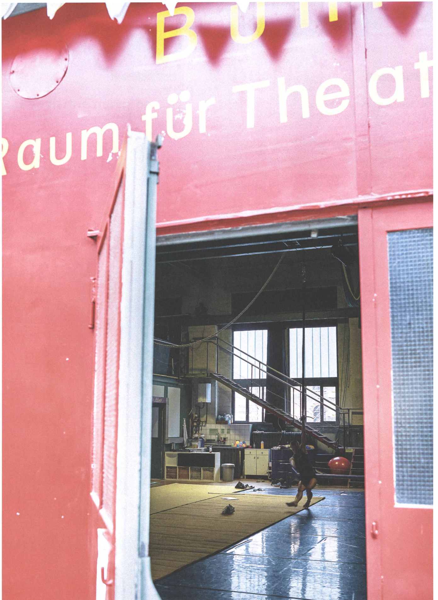
Lagerplatz Winterthur: In alten Bauten rentiert auch eine Zirkus- und Theaterschule.