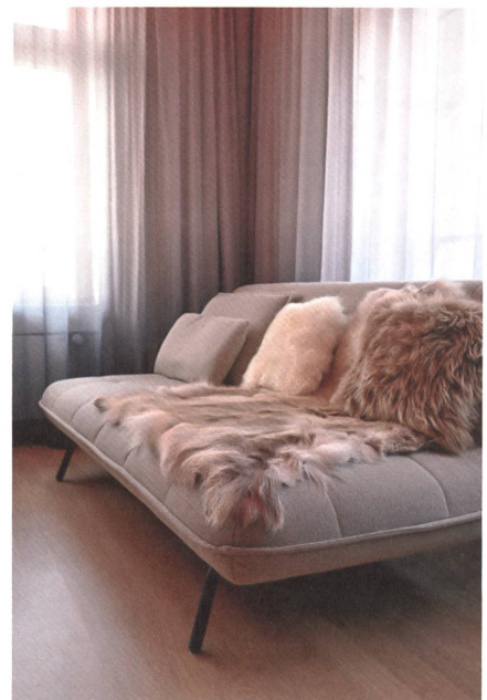
Plaid, Vorhänge, Polsterstoff: Textilien in den unterschiedlichsten Funktionen schaffen die behagliche Stimmung der Räume.