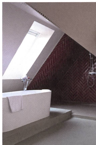
Die Badezimmer unter dem Dach erinnern an private Loftwohnungen.