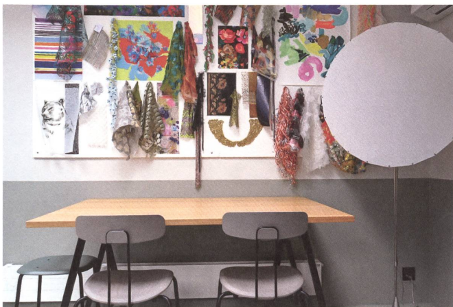
Ein grosser Holztisch bietet – anders als für diese Preisklasse gewohnt – viel Platz.