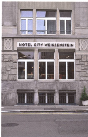
Im einstigen Stickereigeschäftshaus von 1911 empfängt das neue Boutique-Hotel seine Gäste.