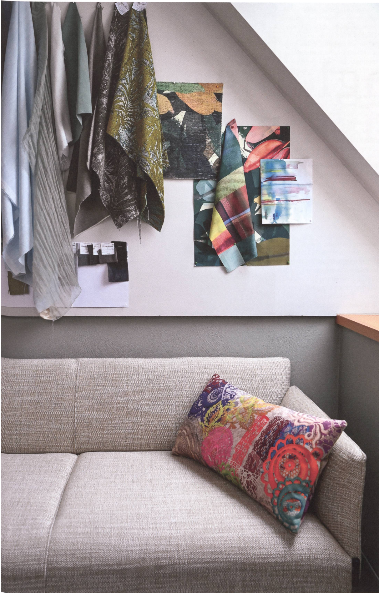
Anfassen erwünscht: Die Interieurs des Hotel City Weissenstein huldigen der Textilstadt St. Gallen.