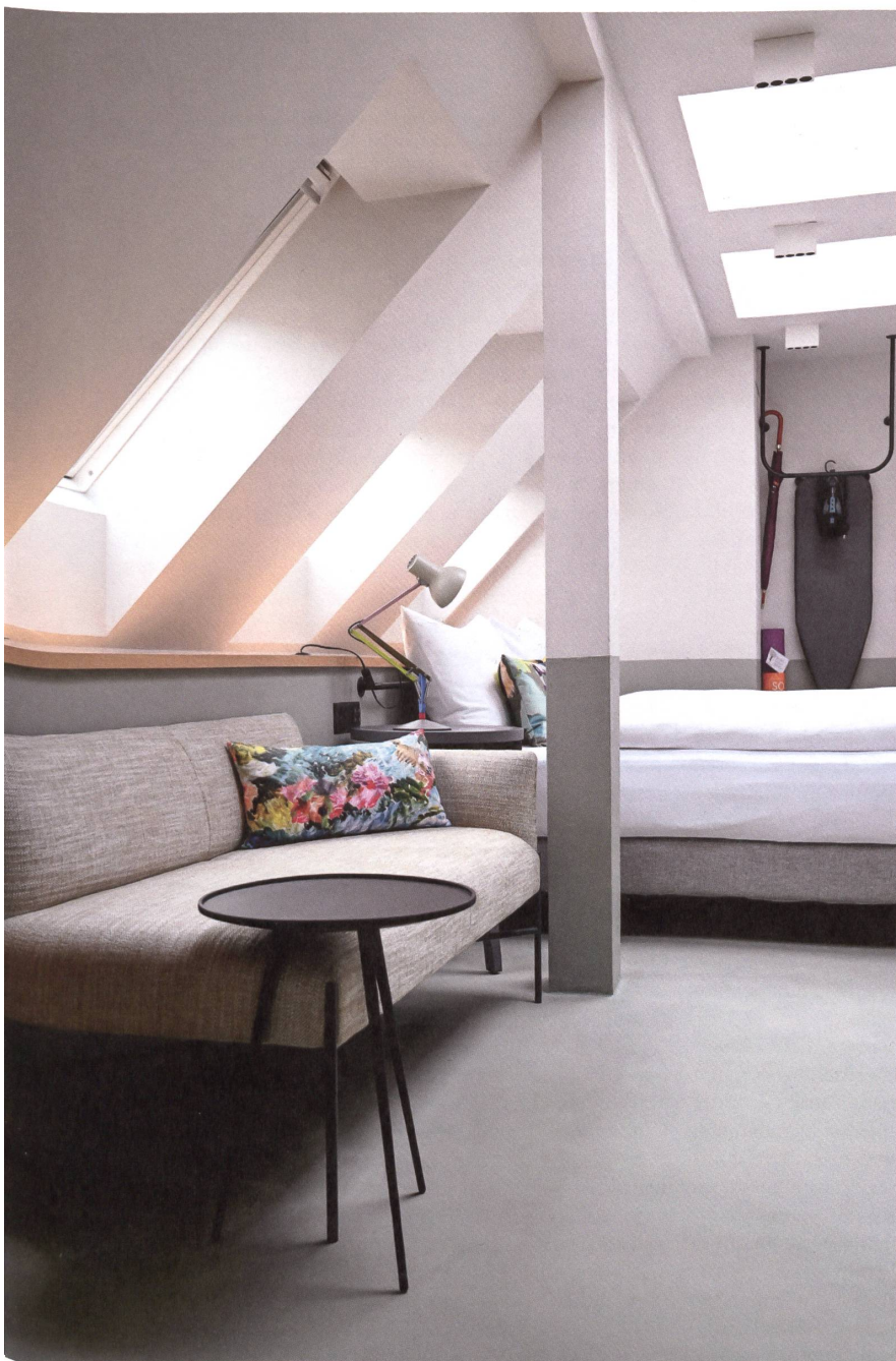
Grau angesetzt: Mit einem einfachen farblichen Trick gewinnen die Suiten unter dem Dach optisch an Höhe.