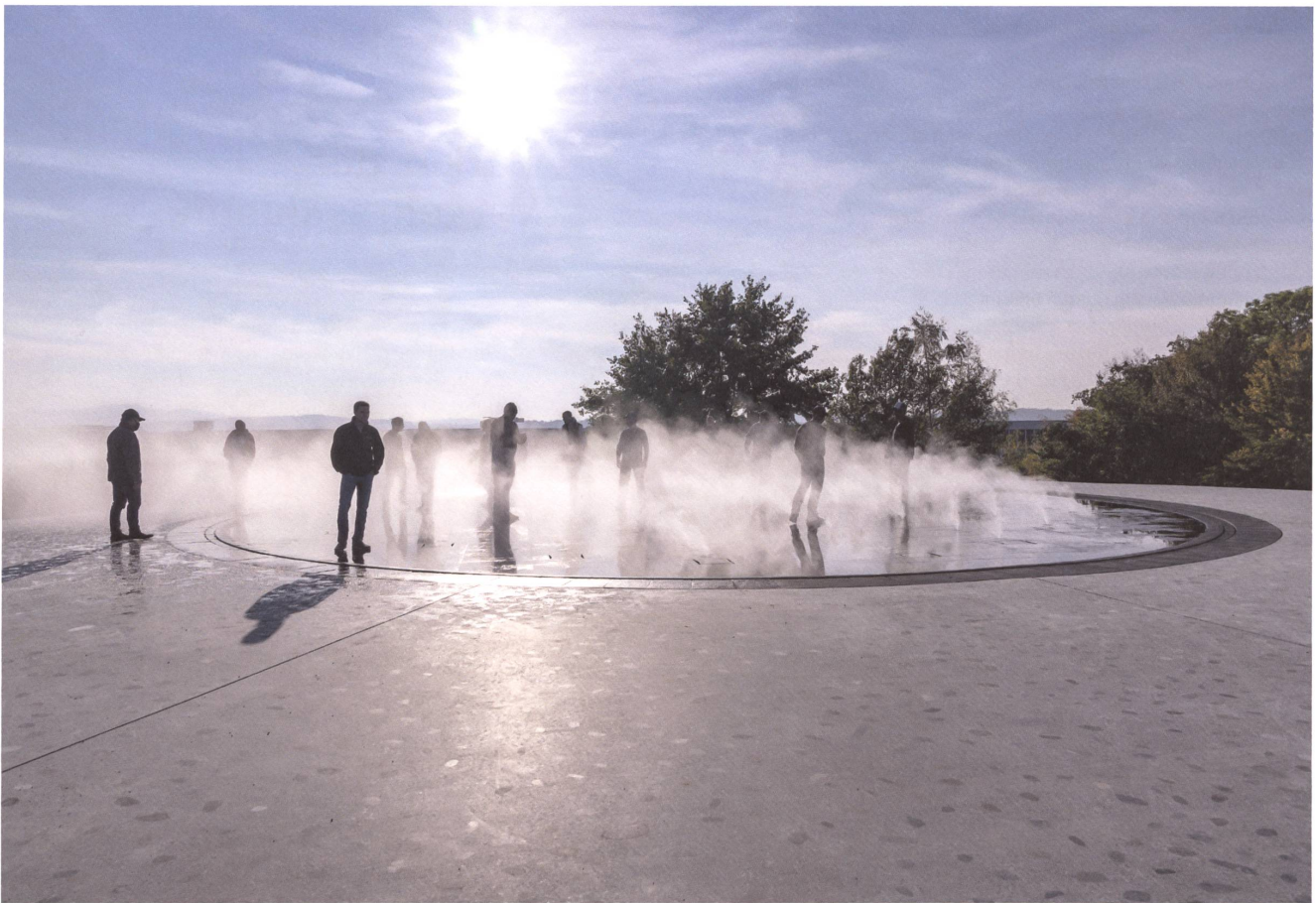
Auf dem höchsten Punkt liegt die Himmelsplattform. Das Wasserspiel auf der kreisrunden Betonplatte bietet ein sinnliches Gipfelerlebnis.