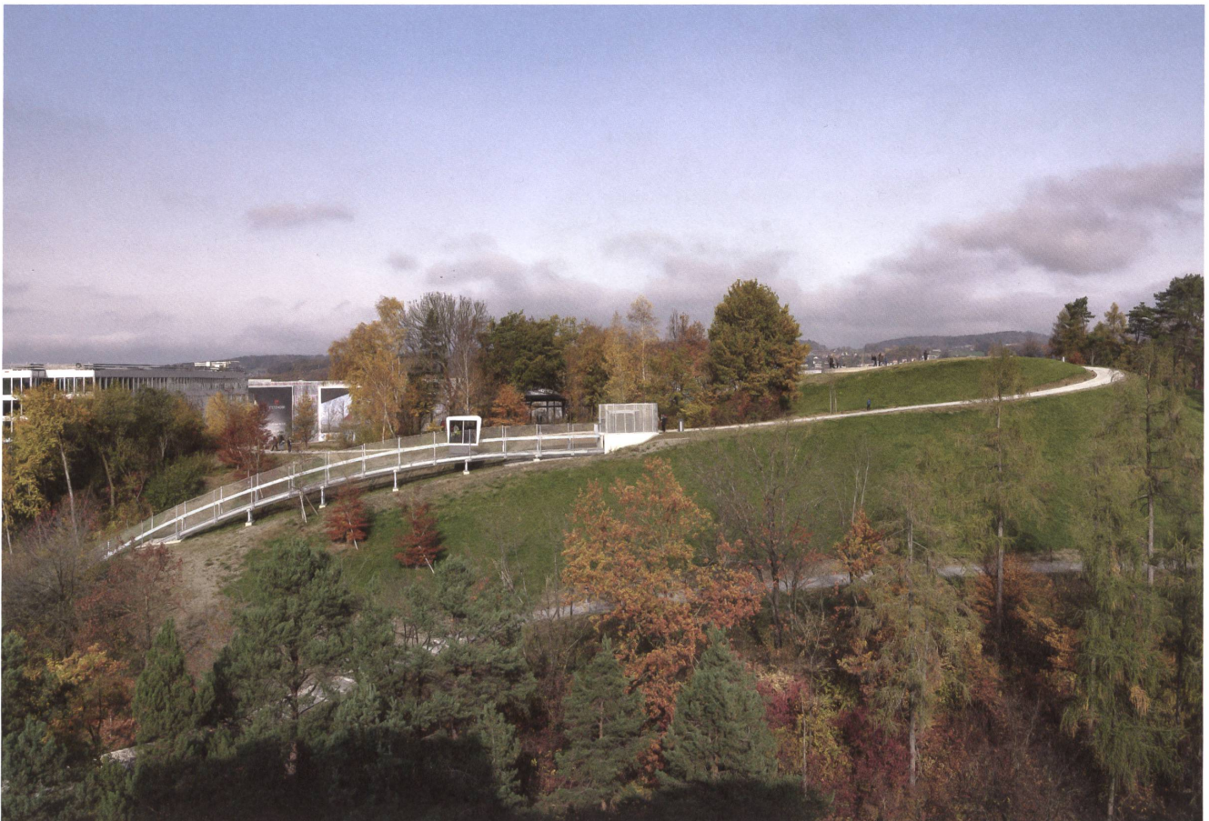
Blick aus einem Bürofester des «Circle» Richtung Norden: Ein klobig geratener Standlift transportiert die Besucher direkt auf den «Skyloop».