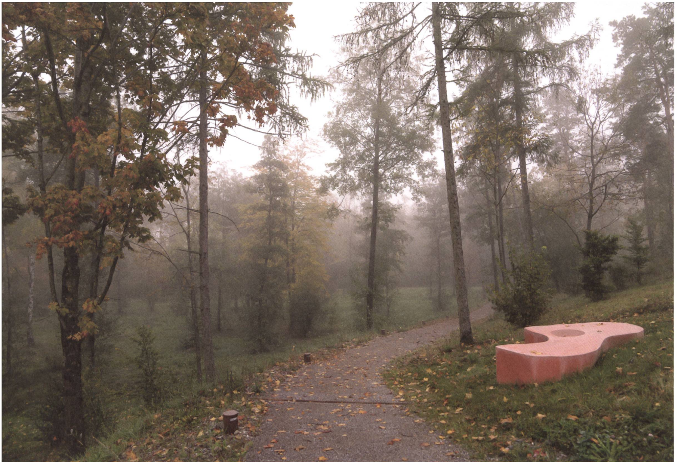
Der «Offenwald» bildet die Schnittstelle zwischen Wald und Park. Der Flughafen-Park ist auch ein Pilotprojekt zum Thema Erholungs- oder Siedlungswald.