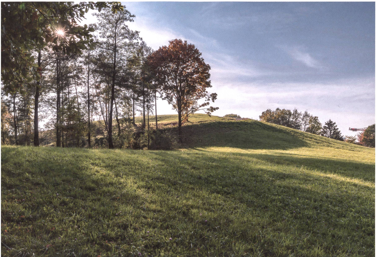
Diese Wiesenfläche auf der Nordseite des Parks ist nicht geschützt. Sie könnte im Sommer zum Beispiel für ein Openair-Kino genutzt werden.