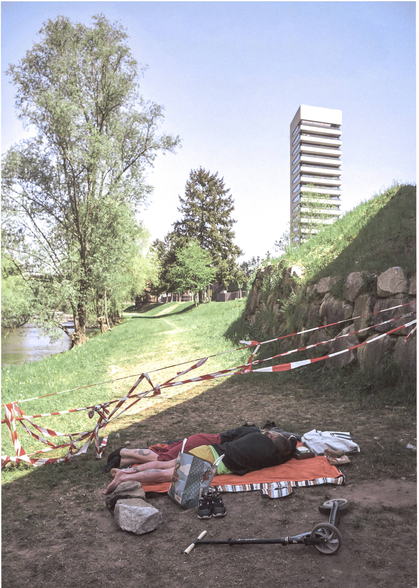
Landschaft ist grenzenlos. Das zeigt sich besonders, wenn die Pandemie im trinationalen Raum wieder Grenzen erzwingt.