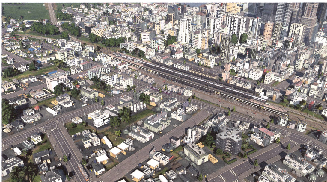
Für ein Simulationsspiel aussergewöhnlich detailliert: eine Grossstadt mit dichtem Verkehrsnetz in «Transport Fever 2».

Text: Urs Honegger, Visualisierungen: Urban Games