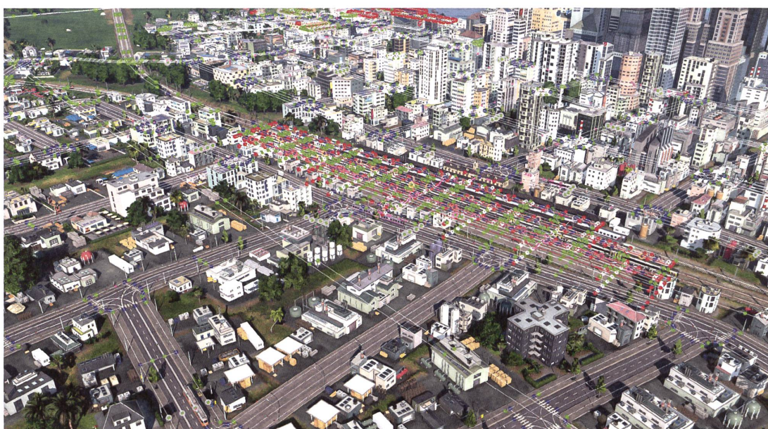
Das System zeigt alle Verkehrsknotenpunkte an: Rote Punkte stehen für lose Enden, an grünen Punkten treffen sich zwei Verbindungen, an blauen drei und an weissen vier oder mehr.