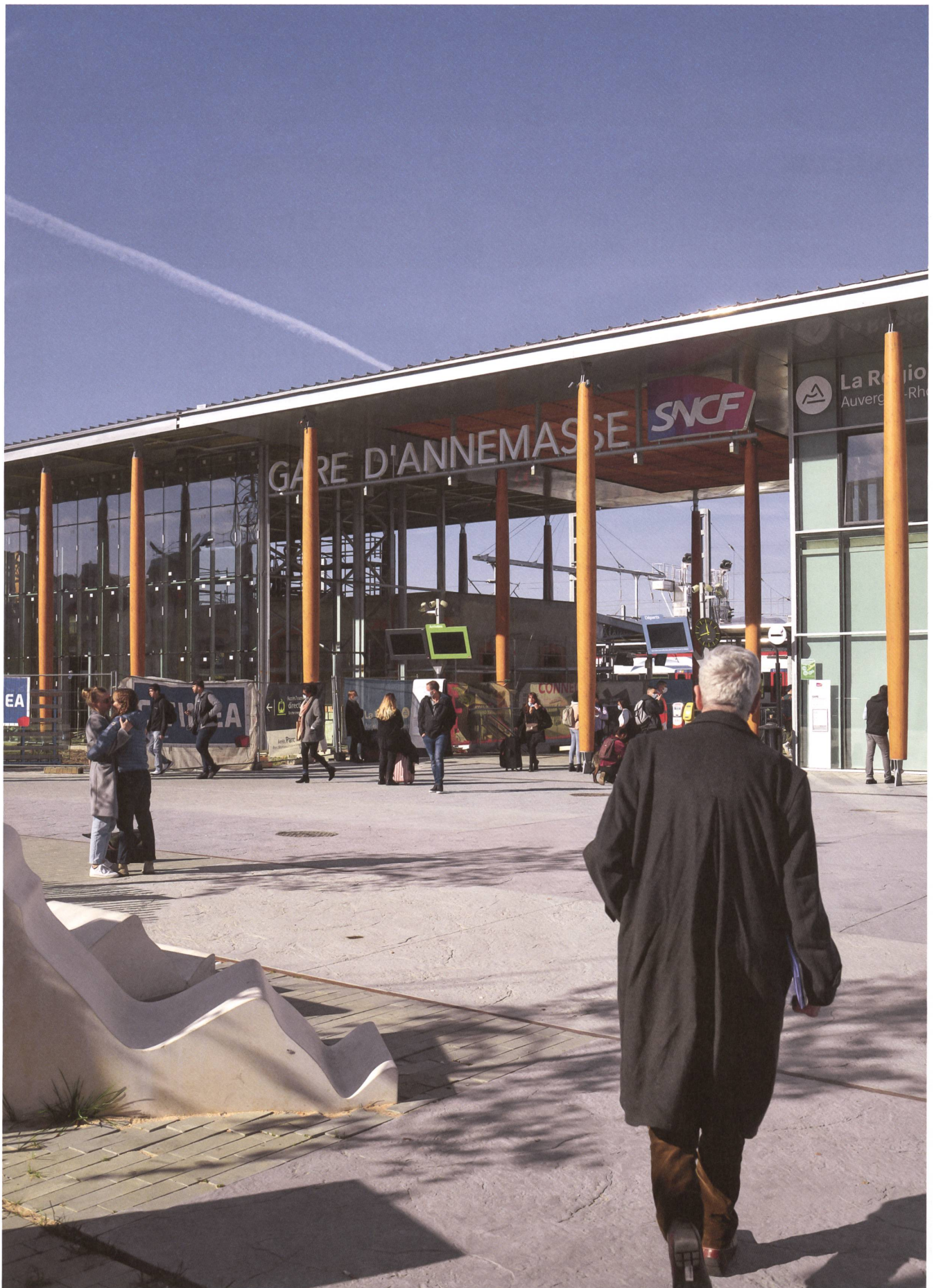
Das westliche Ende der neuen Bahnstrecke CEVA: der Bahnhof Annemasse.