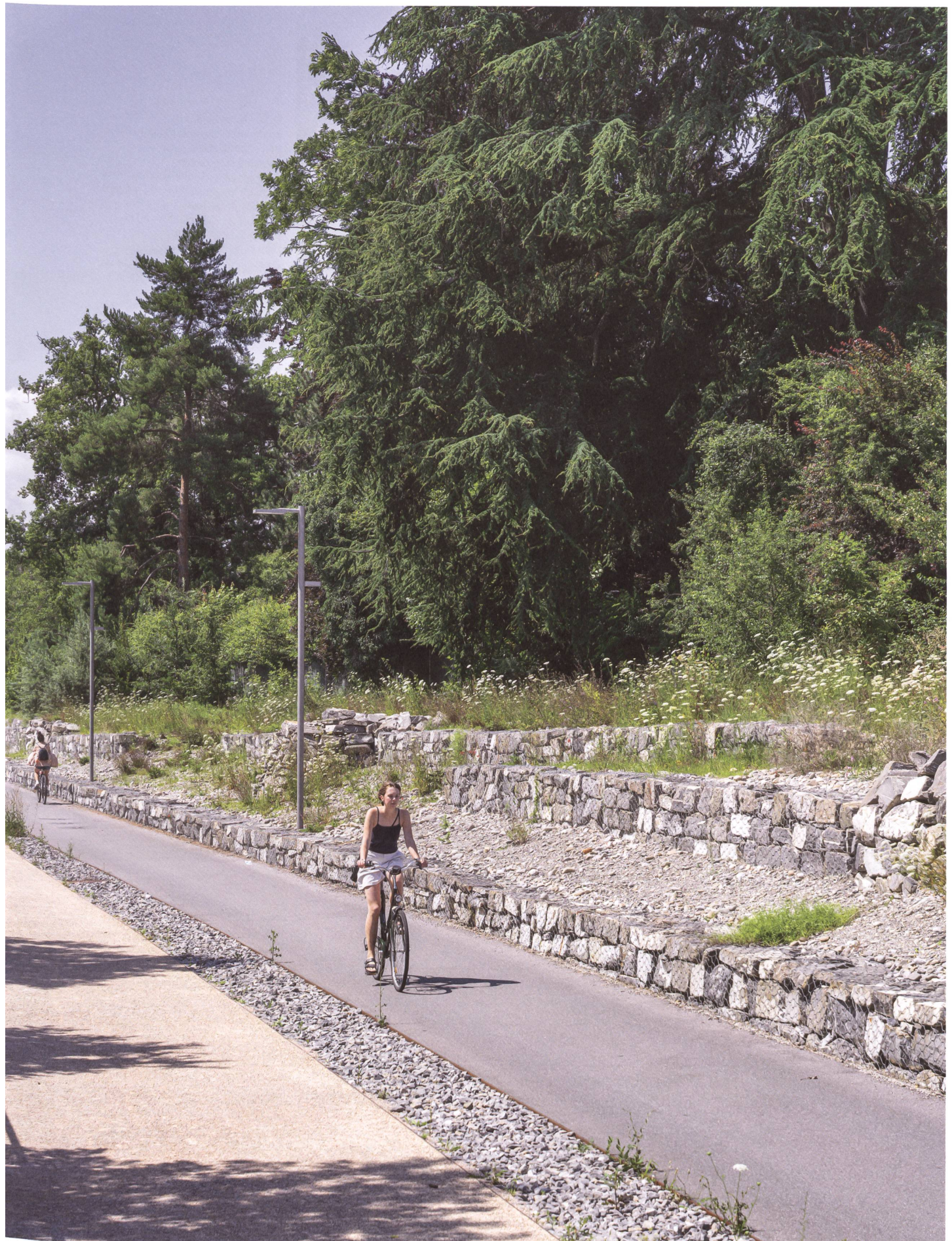
Den Menschen bietet die «Voie verte» grosszügige Wege, den Mauereidechsen und Sandschrecken neuen Lebensraum.