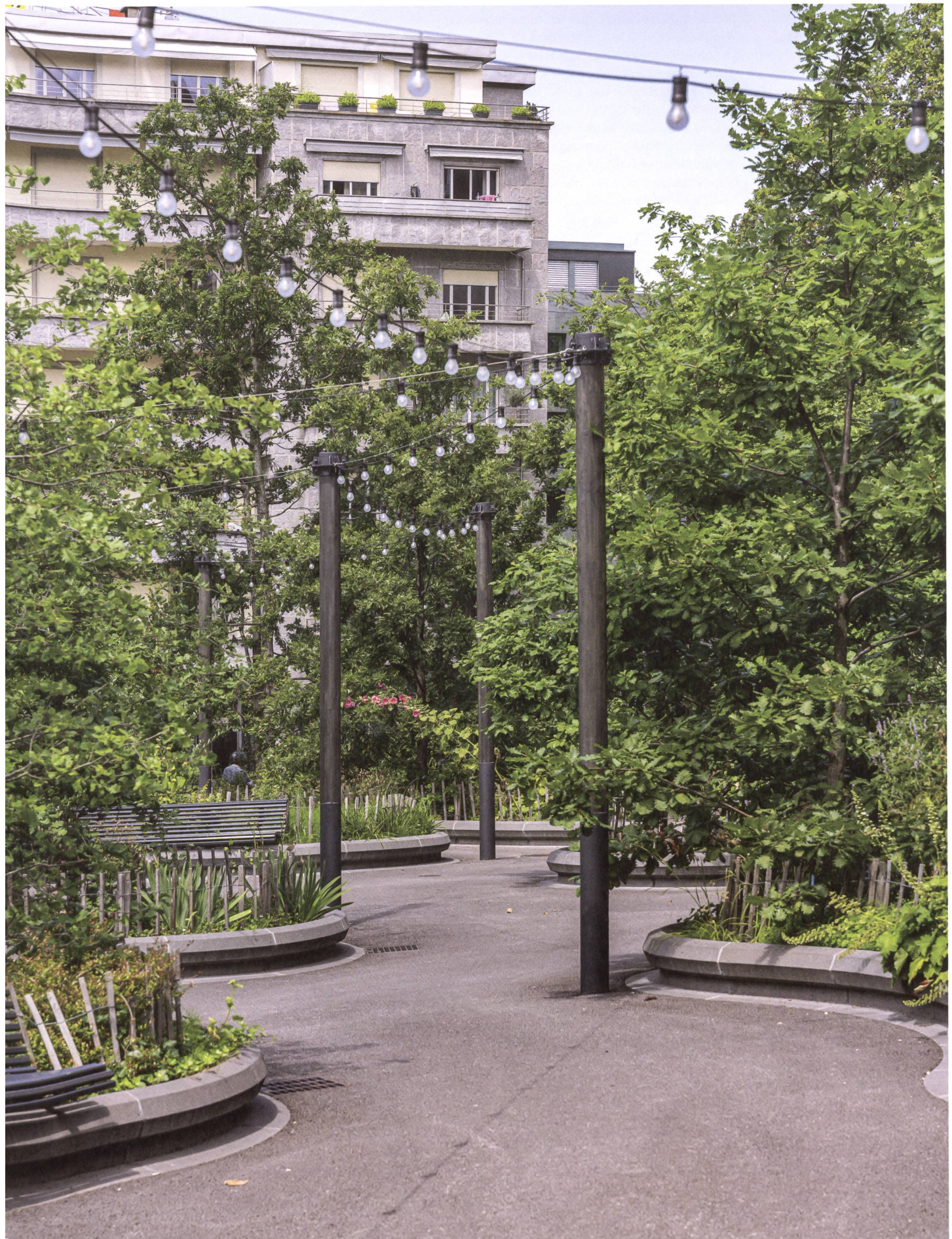
Am Bahnhof Champel formen Eichen, die aus weich geschwungenen Trögen wachsen, einen Ruheraum.