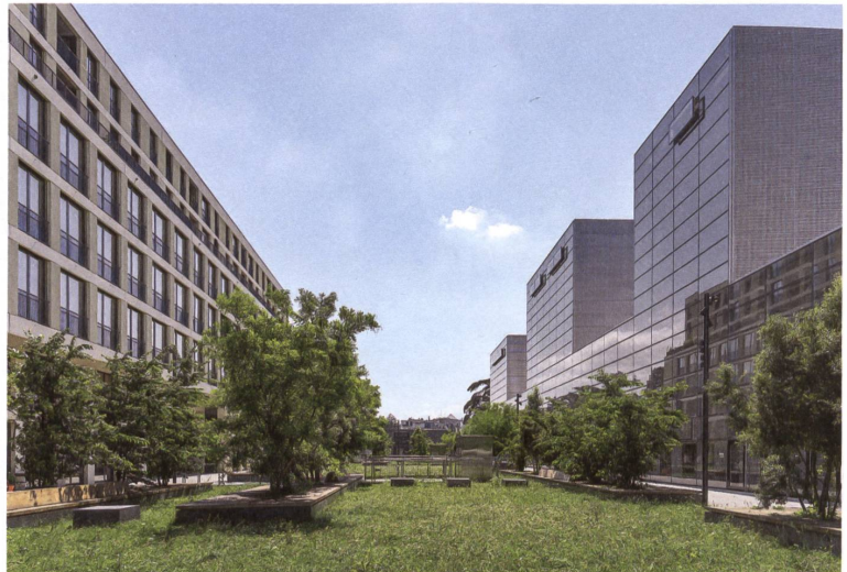
Ein Ort für Pausen: der Rasenpark an der Esplanade Alice-Bailly.