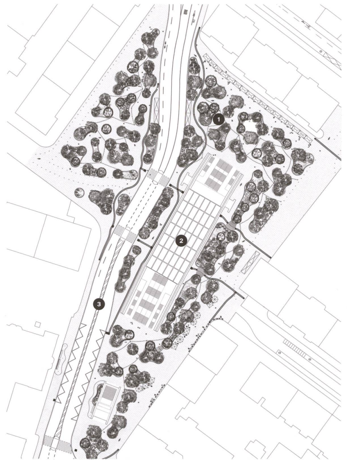
Situationsplan Champel: 1 Eichenwald, 2 Zugang zum Bahnhof, 3 Avenue de Champel

Herzstück des Aussenraums von Eaux-Vives ist jedoch die Esplanade Alice-Bailly, die den Bahnhof und das Shoppingareal überdeckt. Ein gärtnerisch-grüner Raum streckt sich in die Länge, ein Rasenpark, den zahlreiche Pflanz- und Sitzinseln gliedern wie abgestellte Eisenbahnwaggons. Deren Kubatur überspielt die Höhe der Substratschicht, die nötig war, um die mehrstämmigen Kleingehölze auf der Überdeckung zu pflanzen. Flankiert wird die Rasenfläche von grossformatigen Betonplatten, deren Format die Module des Bahnhofgebäudes aufgreift. Übertagt von den gläsernen Fassaden der «Nouvelle Comédie», bietet der Minipark optisch eine grüne Lunge im Bahnhofsgewusel wie auch einen ruhigen Vorplatz für das Theater. Ein gelungener Aufenthaltsort – der ökologische Wert bleibt allerdings klein. ●