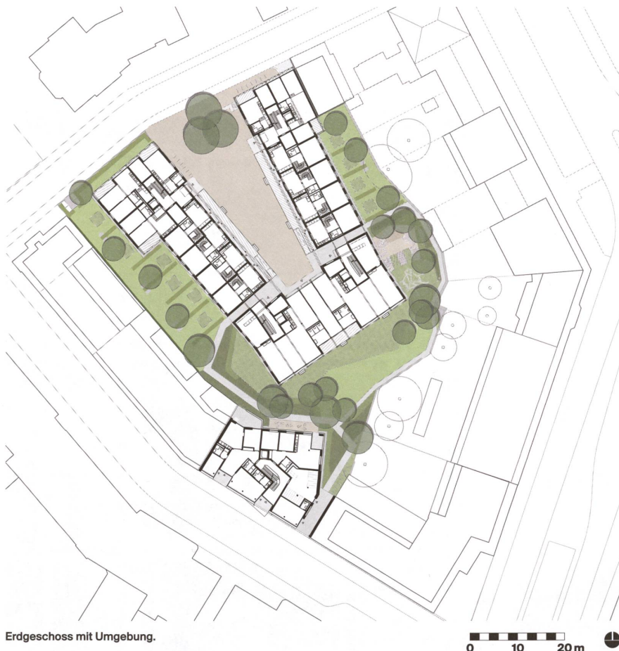
Erdgeschoss mit Umgebung.