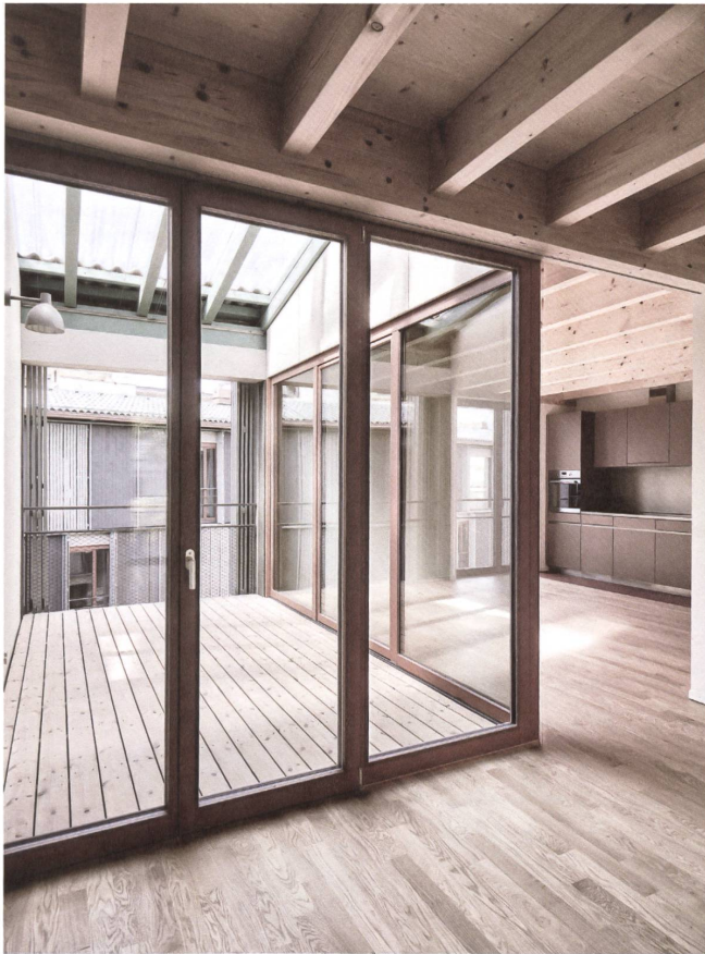
Die Träger bilden mal Tür-, mal Fenstersturz und gewinnen dazwischen wertvolle Raumhöhe.