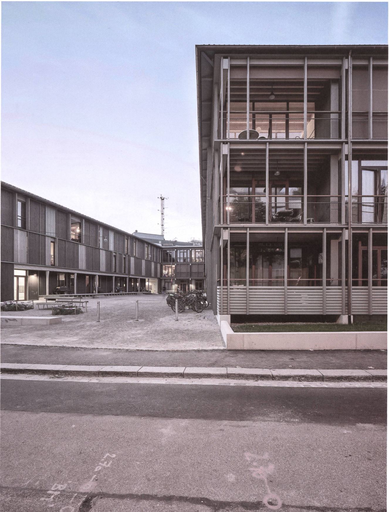
Ein geklester Platz führt von der Malengasse in die Tiefe und erschliesst alle 39 Wohnungen.