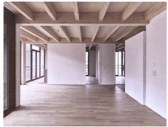
In Querrichtung liegt alle 66 Zentimeter ein Deckenbalken auf den Primärträgern.