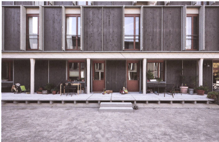
Die Verandastützen der Wohnüberbauung Maiengasse in Basel schrauben sich vom Quadrat zum 32-Eck.