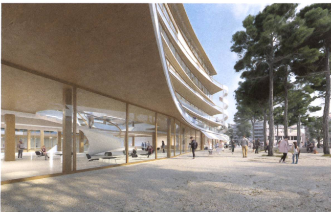
Die geschwungene Form und die durchlässige Fassade setzen das Haus in einen subtilen Bezug zur Stadt. Visualisierungen des Siegerprojekts von Pascal Flammer.