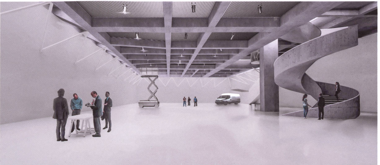
Das Eingangsgeschoss wird zur Strasse abgesenkt, der historische Museumsbau schwebt über einer gigantischen Halle: Christian Kerez' Vorschlag für die Erneuerung des Textilmuseums in St. Gallen. Visualisierungen des Siegerprojekts von Christian Kerez.