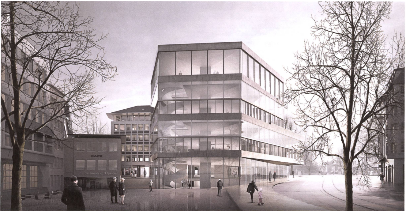
Die von Staab Architekten entworfene Bibliothek markiert den städtebaulichen Schnittpunkt zwischen Altstadt und Bahnhofsviertel.