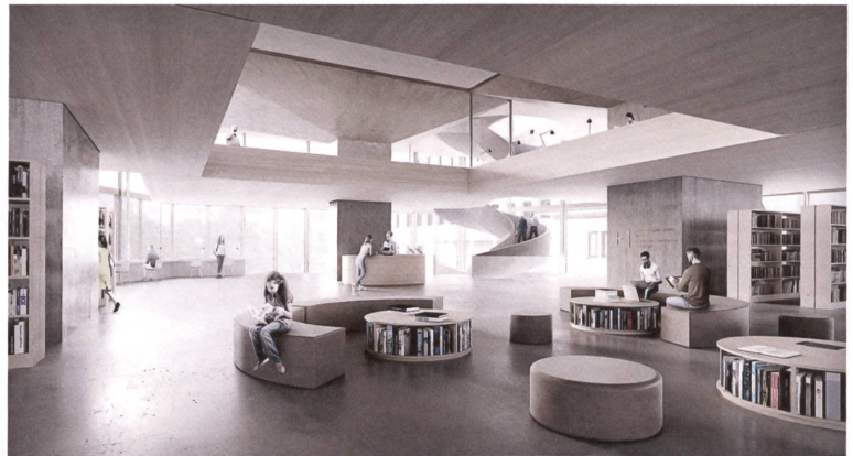
Doppelgeschossige Räume mit Galerien versprechen ein reiches Innenleben.