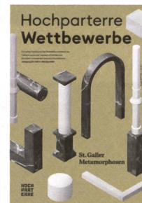
Die St. Galler Wettbewerbe im Detail Eine ausführliche Dokumentation und Analyse der hier besprochenen Projekte sowie der konkurrierenden Entwürfe findet sich im aktuellen Hochparterre Wettbewerbe 4/21.

Das prämierte Projekt von Staab Architekten für die Neue Bibliothek trägt allerdings eine Hypothek mit sich herum. Nicht zuletzt im Hinblick auf die Kosten von 137 Millionen Franken, die an der Urne erst noch genehmigt werden müssen, würde das gemeinsame Projekt von Stadt und Kanton die Unterstützung, ja, regelrecht die Begeisterung der Bevölkerung brauchen. Hört man sich →