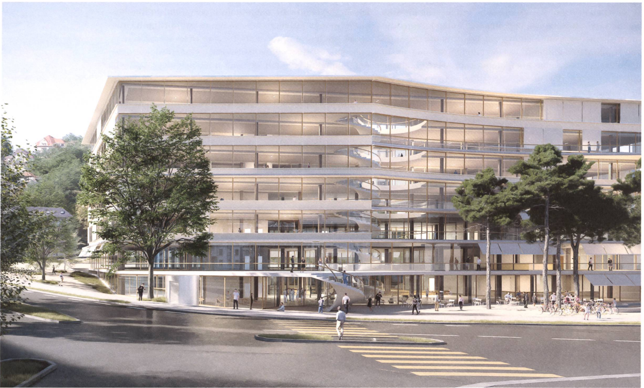
Die Universität St. Gallen in Nachbarschaft der Altstadt: Wo jahrzehntelang Brachland war, soll Pascal Flammer den neuen Universitätscampus bauen.