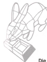
Die Jury sagt