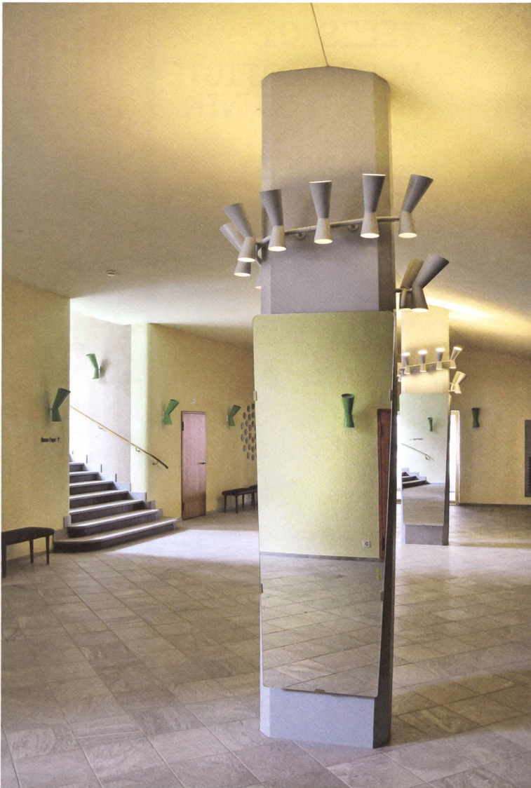
Die Eingangshalle mit neuen Leuchten, deren Form sich an die Bauzeit anlehnt.