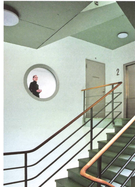
Treppenhaus für die Mitarbeitenden.