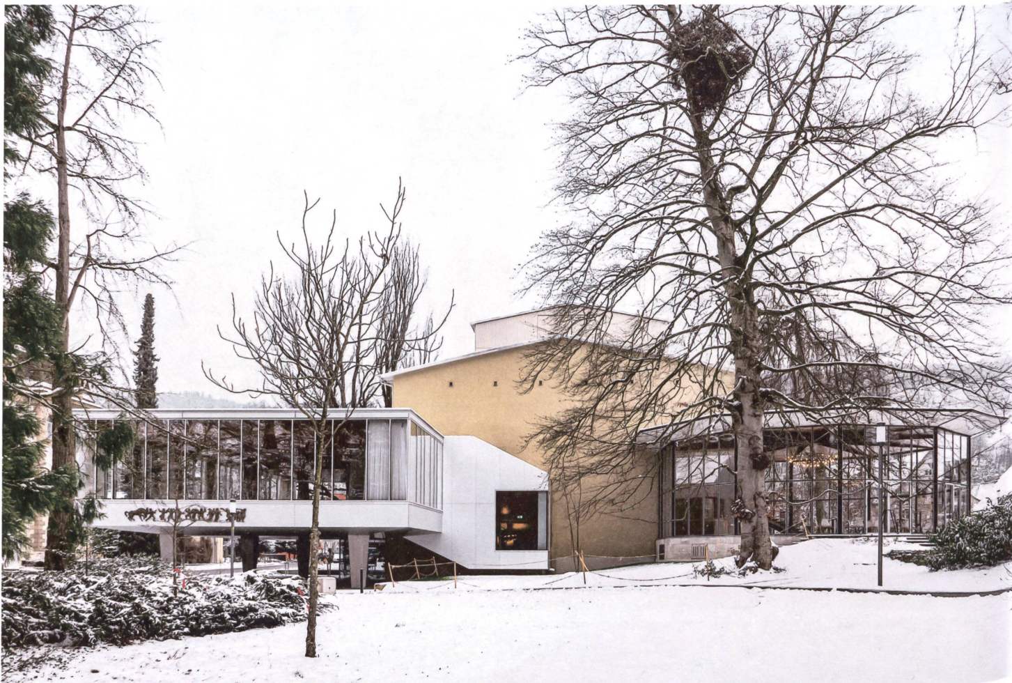
Balance des Ungleichen: Das Kurtheater mit dem Sachs-Foyer rechts und dem neuen Foyer links, verbunden über den Eingangsbereich.