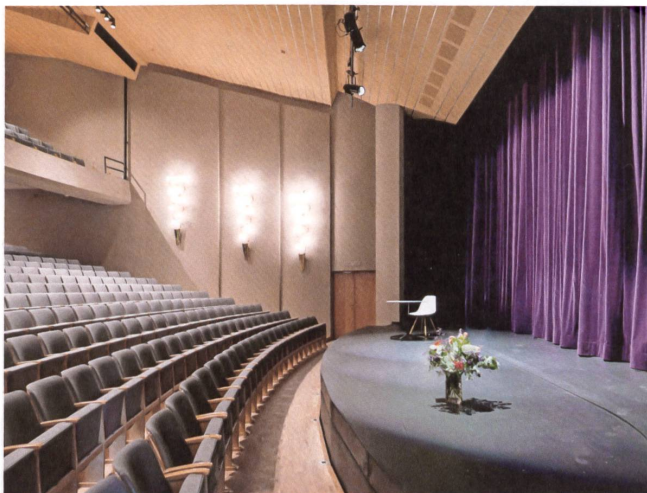
Die Sessel im Saal sind neu gepolstert, die Leuchten wieder installiert.

Die Architektin und der Architekt (beide 70) führen ihr gemeinsames Büro in Zürich seit 1982. Das Hauptgewicht ihrer Praxis und Lehre liegt im Umgang mit bestehenden Bauten. In Zürich gestalteten sie zuletzt die Sanierung der Hardbrücke mitsamt den fünf neuen Treppenaufgängen und bauten zusammen mit Diener & Diener das Kongresshaus und die Tonhalle um.